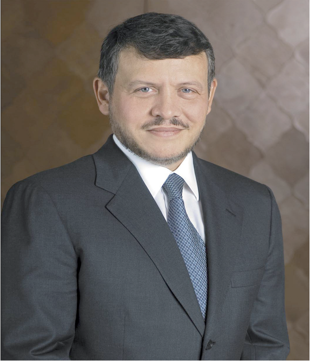
حضرة صاحب الجلالة الملك عبدالله الثاني بن الحسين حفظه الله