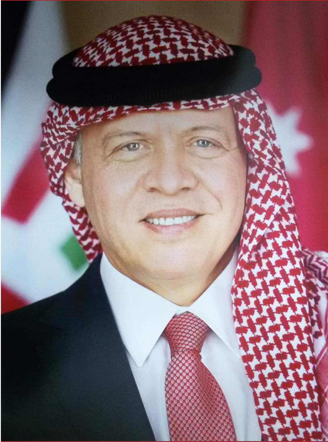
حضرة صاحب الجلالة الهاشمية الملك عبدالله الثاني بن الحسين المعظم (حفظه الله)