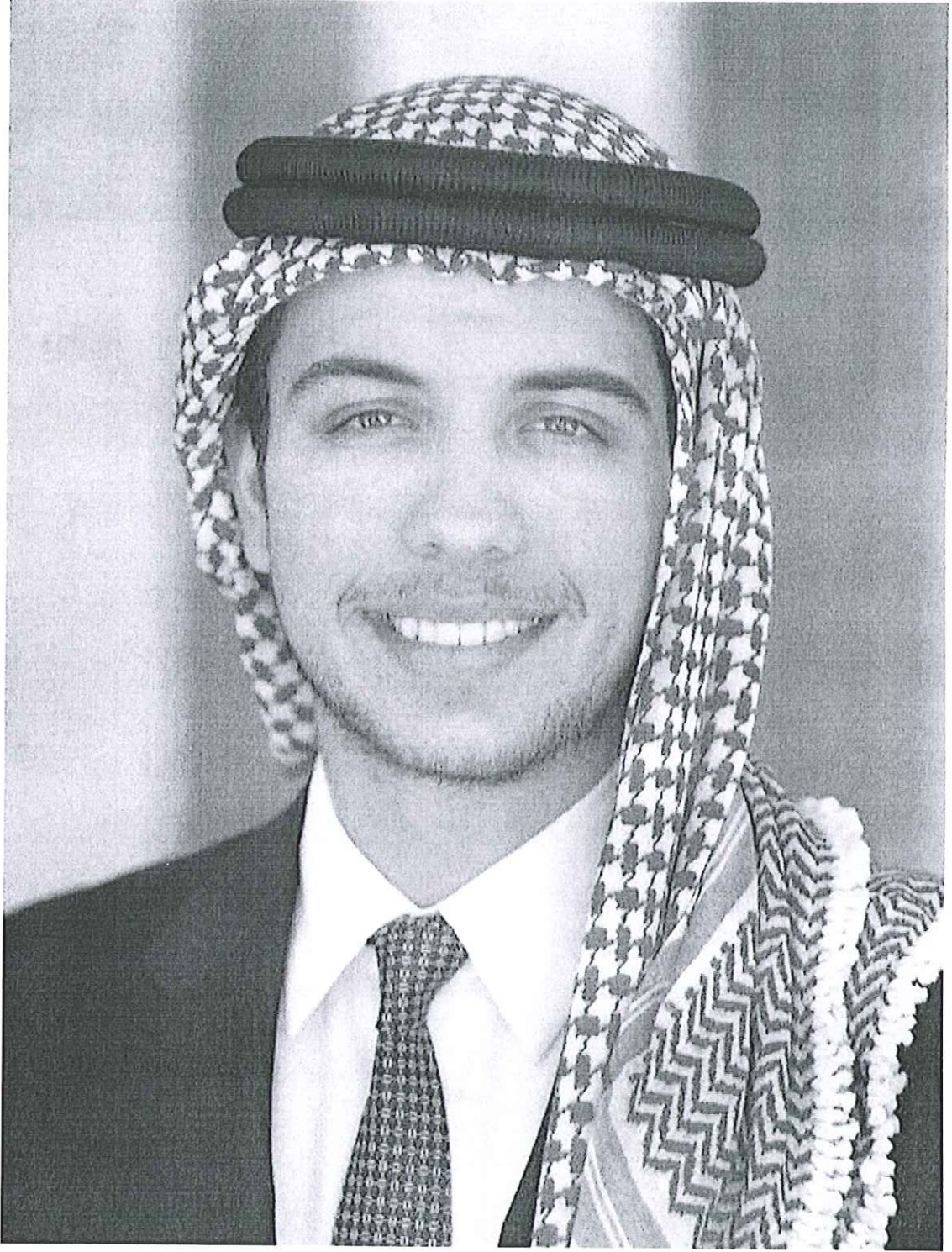
حضرة صاحب السمو الملكي الأمير الحسين بن عبدالله الثاني ولي العهد المعظم