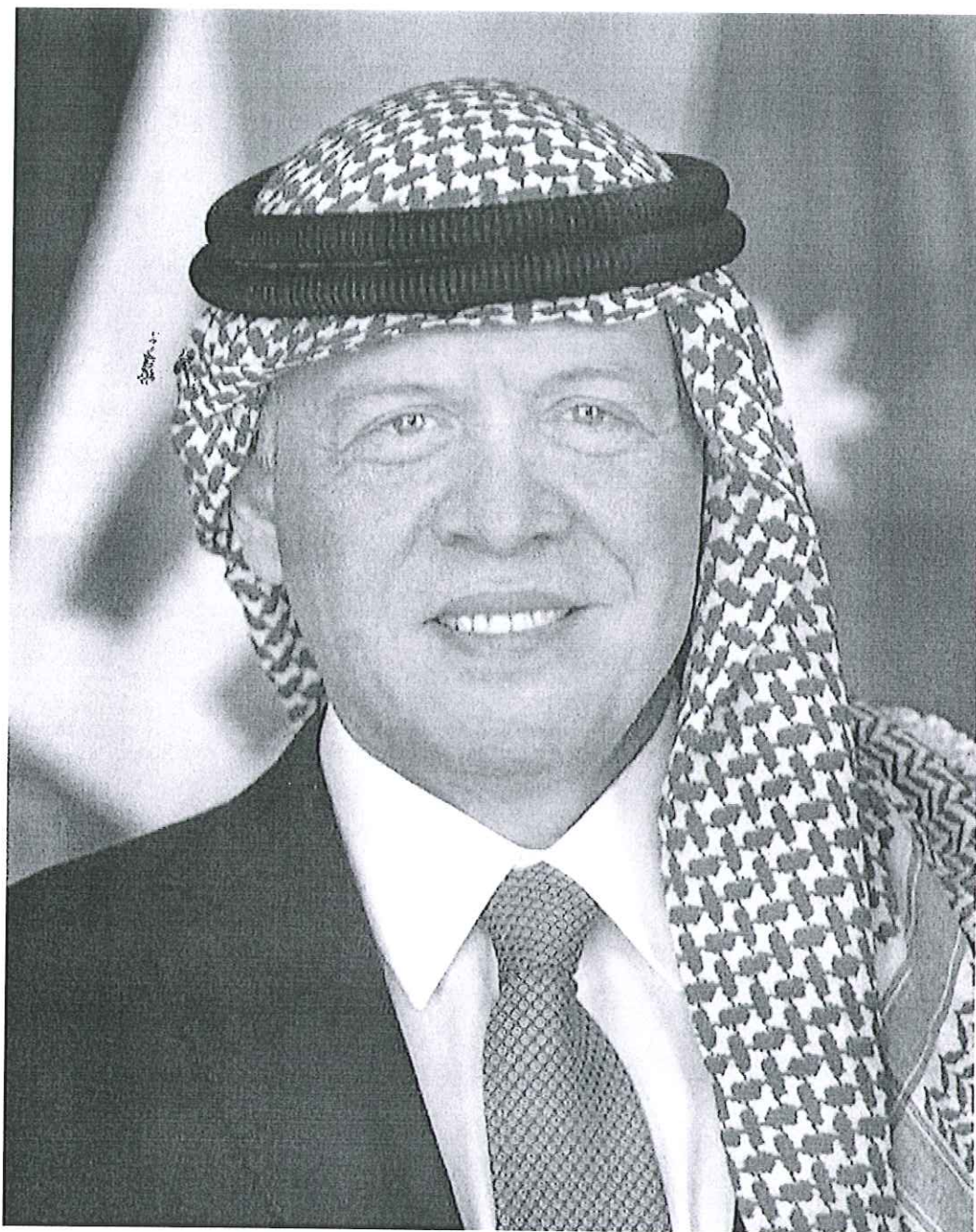
حضرة صاحب الجلالة الهاشمية الملك عبدالله الثاني بن الحسين المعظم