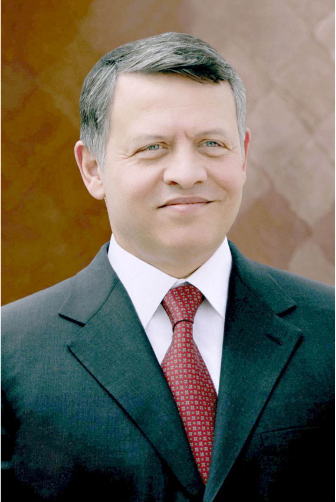
حضرة صاحب الجلالة الملك عبد الله الثاني بن الحسين حفظه الله ورعاه