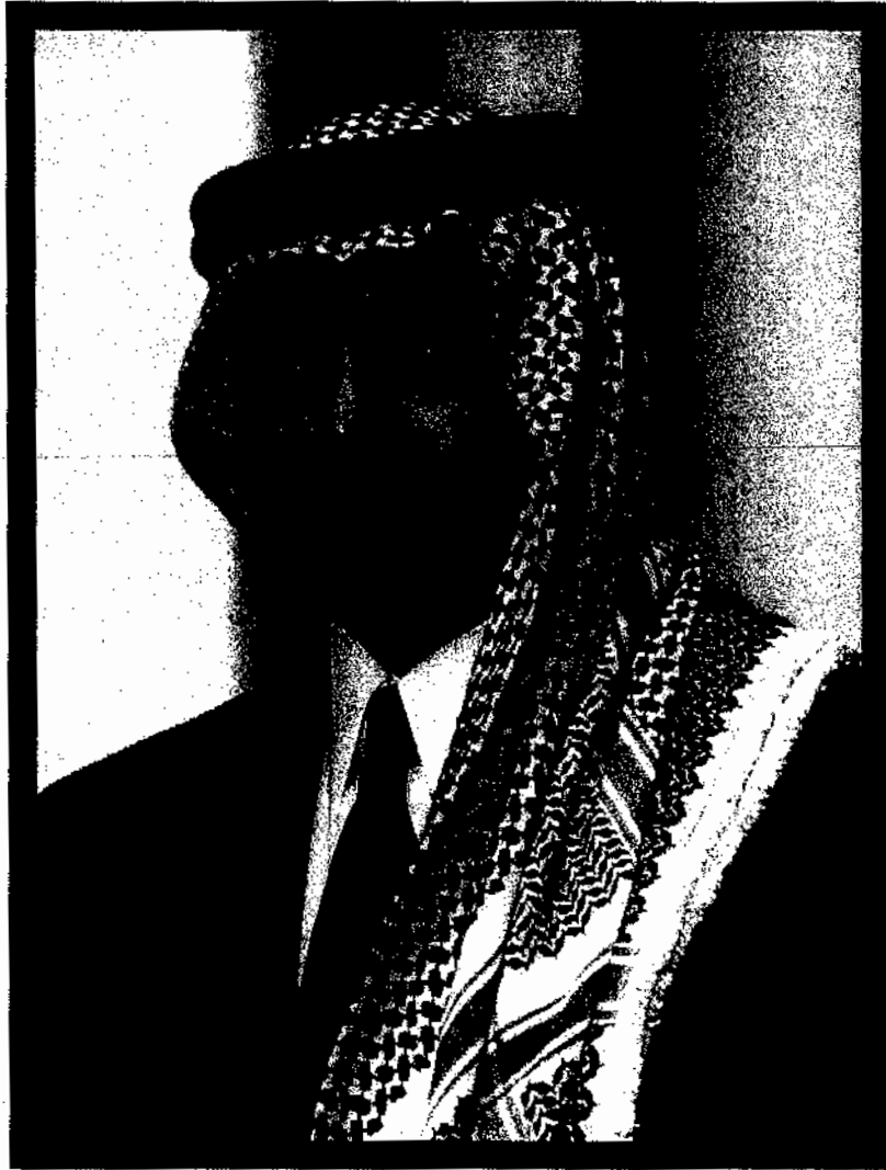
حضرة صاحب الجلالة الملك عبدالله الثاني ابن الحسين المعظم