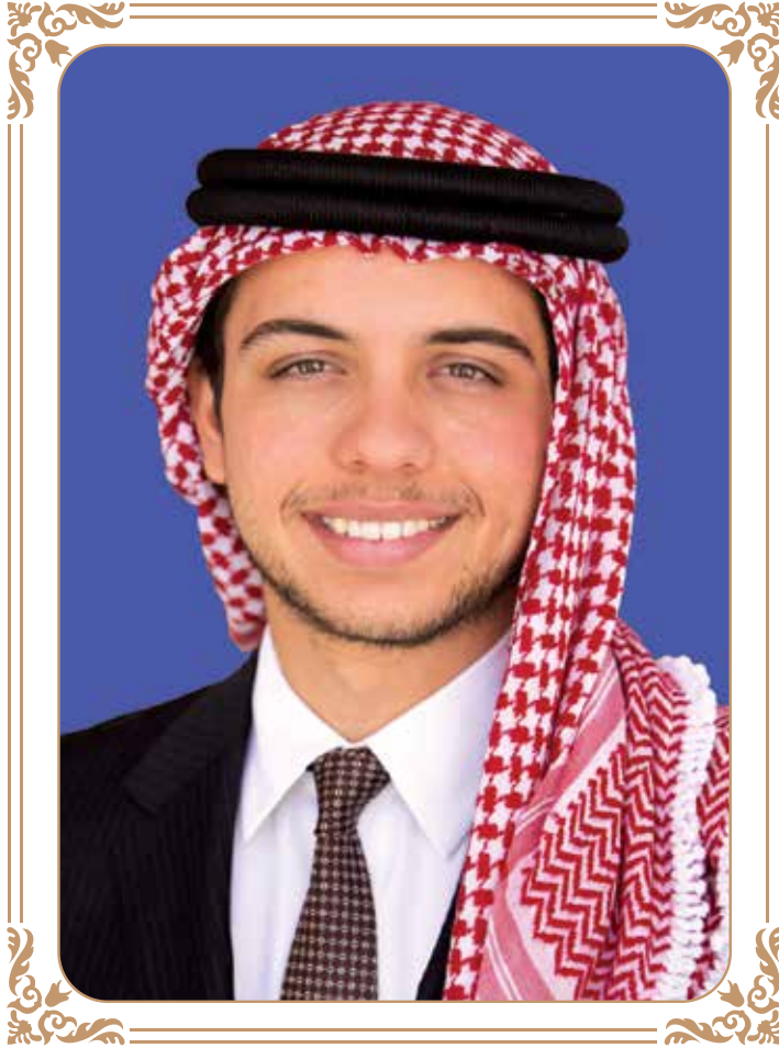
صَاحِبُ السُّهُبِ الْمَلِكِي الْأَمِيرُ الْحُسَيْنُ بْنُ عَبْدِ اللَّهِ الثَّانِي وَوَلِيُّ الْعَهْدِ الْمَعْظُمِ