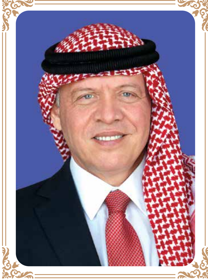
حُضْرَةُ صَاحِبِ الْجَلَالَةِ الْهَاشِمِيَّةِ الْمَلِكُ عَبْدُ اللَّهِ الثَّانِي ابْنُ الْحُسَيْنِ الْمُعَظَّمِ حَفِظَهُ اللَّهُ