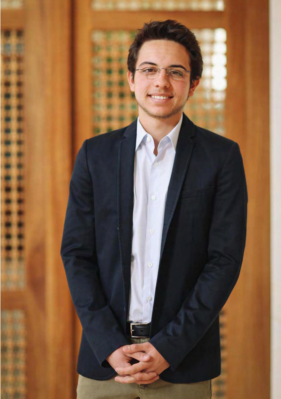
صاحب السمو الملكي الأمير الحسين بن عبد الله الثاني ولي عهد ملك المملكة الأردنية الهاشمية