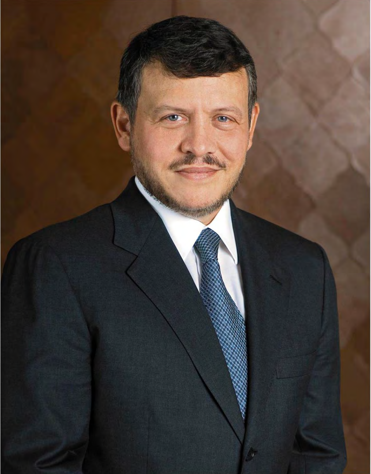
جلالة الملك عبد الله الثاني بن الحسين المعظم ملك المملكة الأردنية الهاشمية