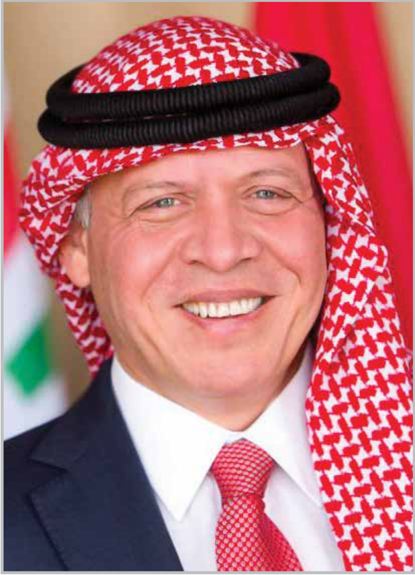
حضرة صاحب الجلالة الملك عبد الله الثاني بن الحسين المعظم