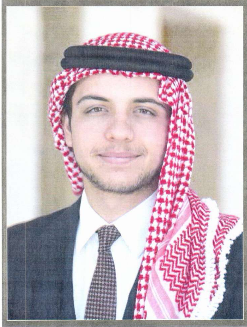
ولاي العهد سمو الأمير الحسين بن عبد الله الثاني