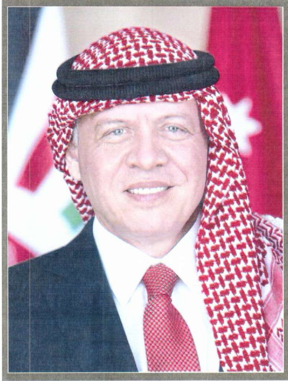
حضرة صاحب الجلالة الملك عبد الله الثاني ابن الحسين المعظم