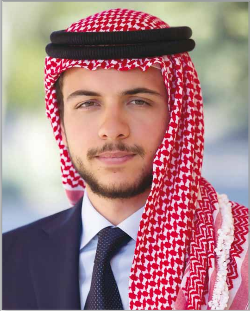
صاحب السمو الملكي الأمير الحسين ابن عبد الله الثاني ولي العهد