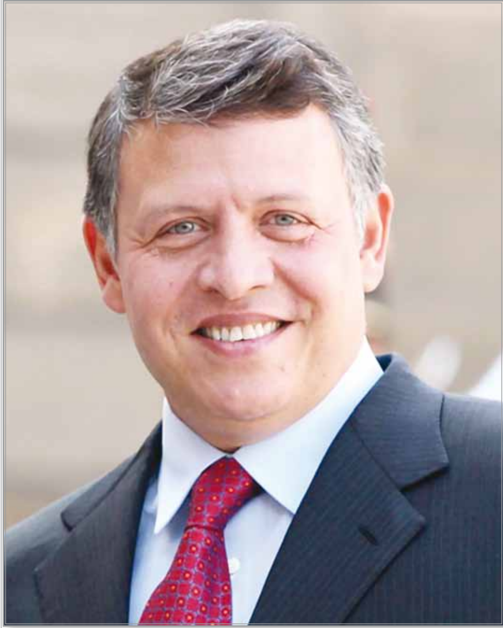
حضرة صاحب الجلالة الهاشمية الملك عبدالله الثاني ابن الحسين المعظم