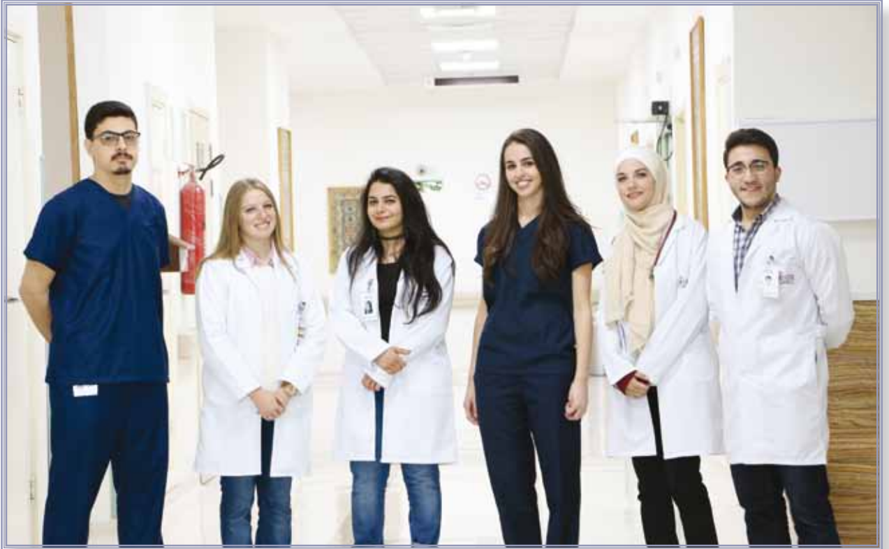
التعليم الطبي المستمر

لا يوجد أي أثر مالي لعمليات ذات طبيعة غير متكررة حدثت خلال السنة المالية ولا تدخل ضمن نشاط الشركة الرئيسي.