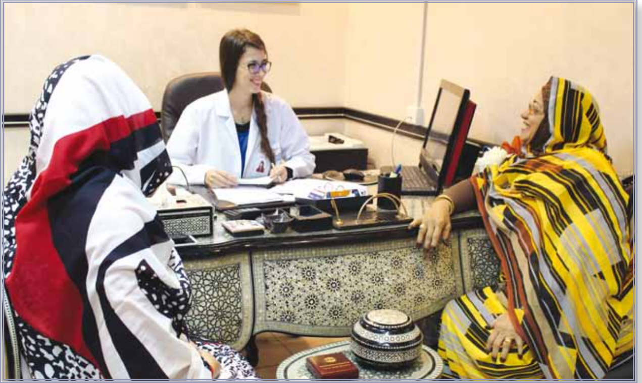
مكتب المرضى الدوليين