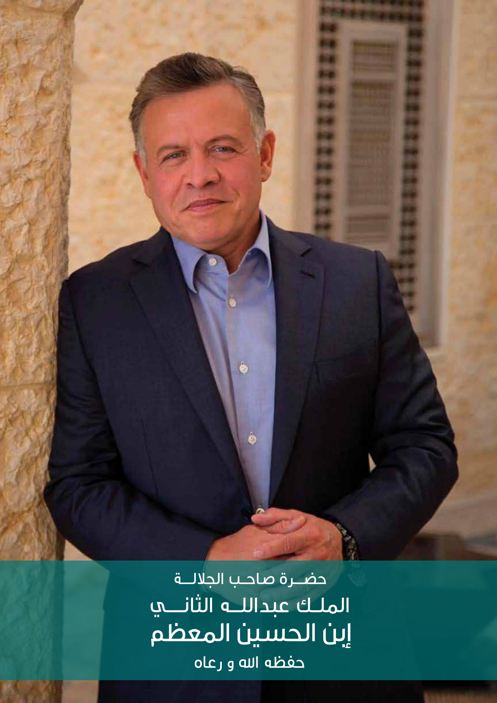
حضرة صاحب الجلالة الملك عبدالله الثاني إبن الحسين المعظم حفظه الله و رعاه