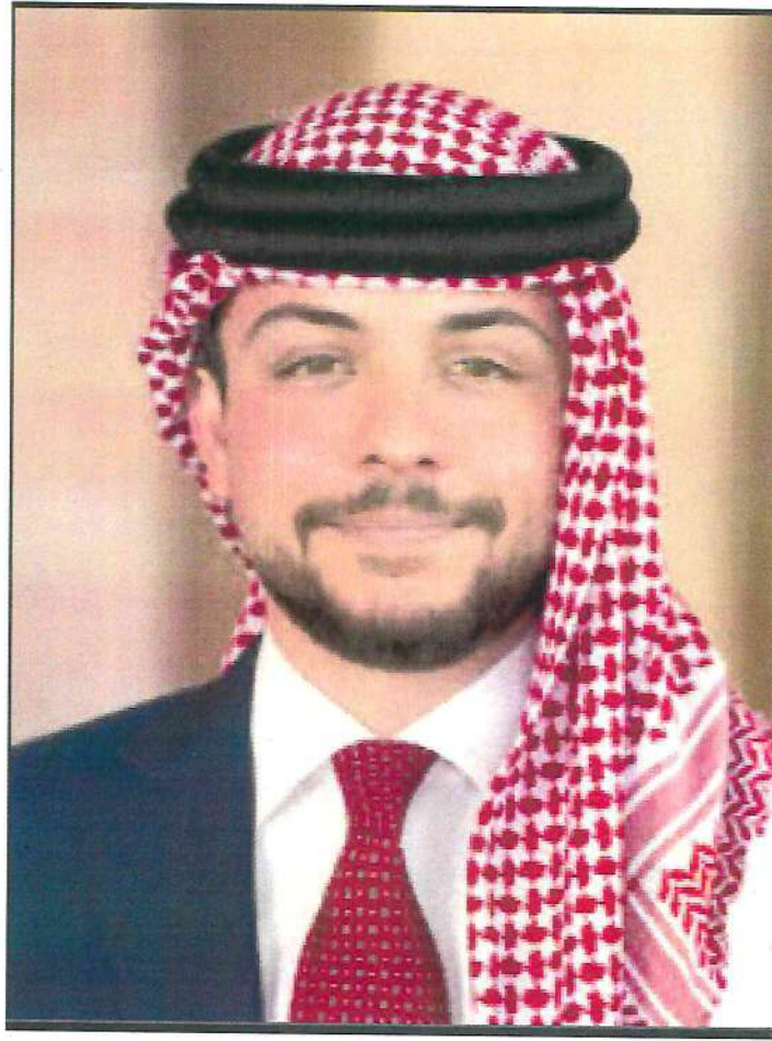
حضرة صاحب السمو الملكي الحسين بن عبد الله الثاني ولي العهد