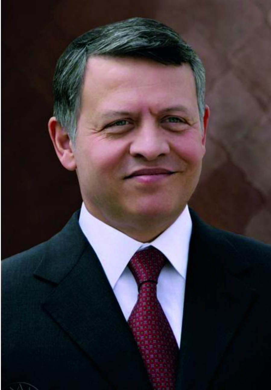
حضرة صاحب الجلالة الملك عبد الله الثاني بن الحسين