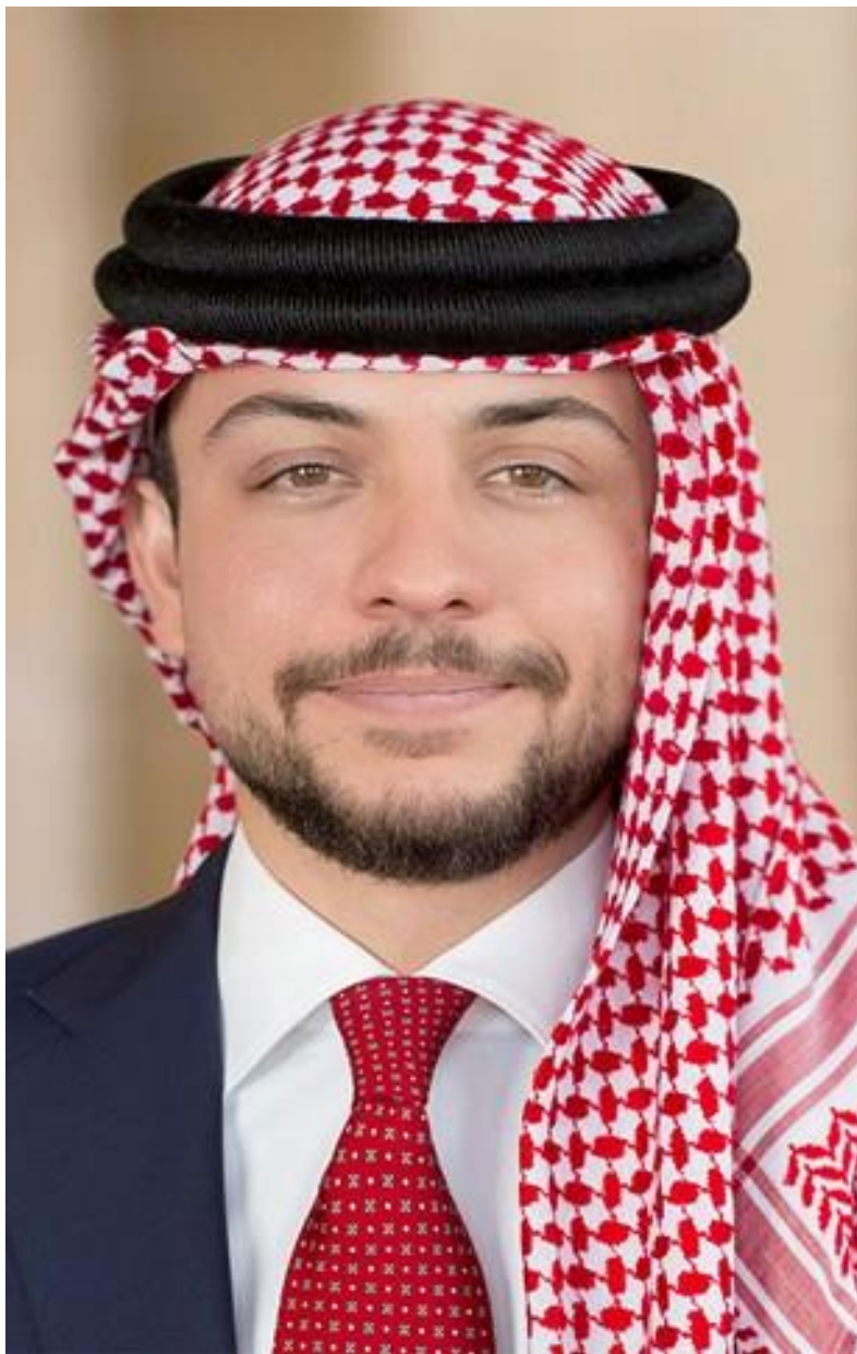
سمو الأمير الحسين بن عبد الله الثاني ولي العهد