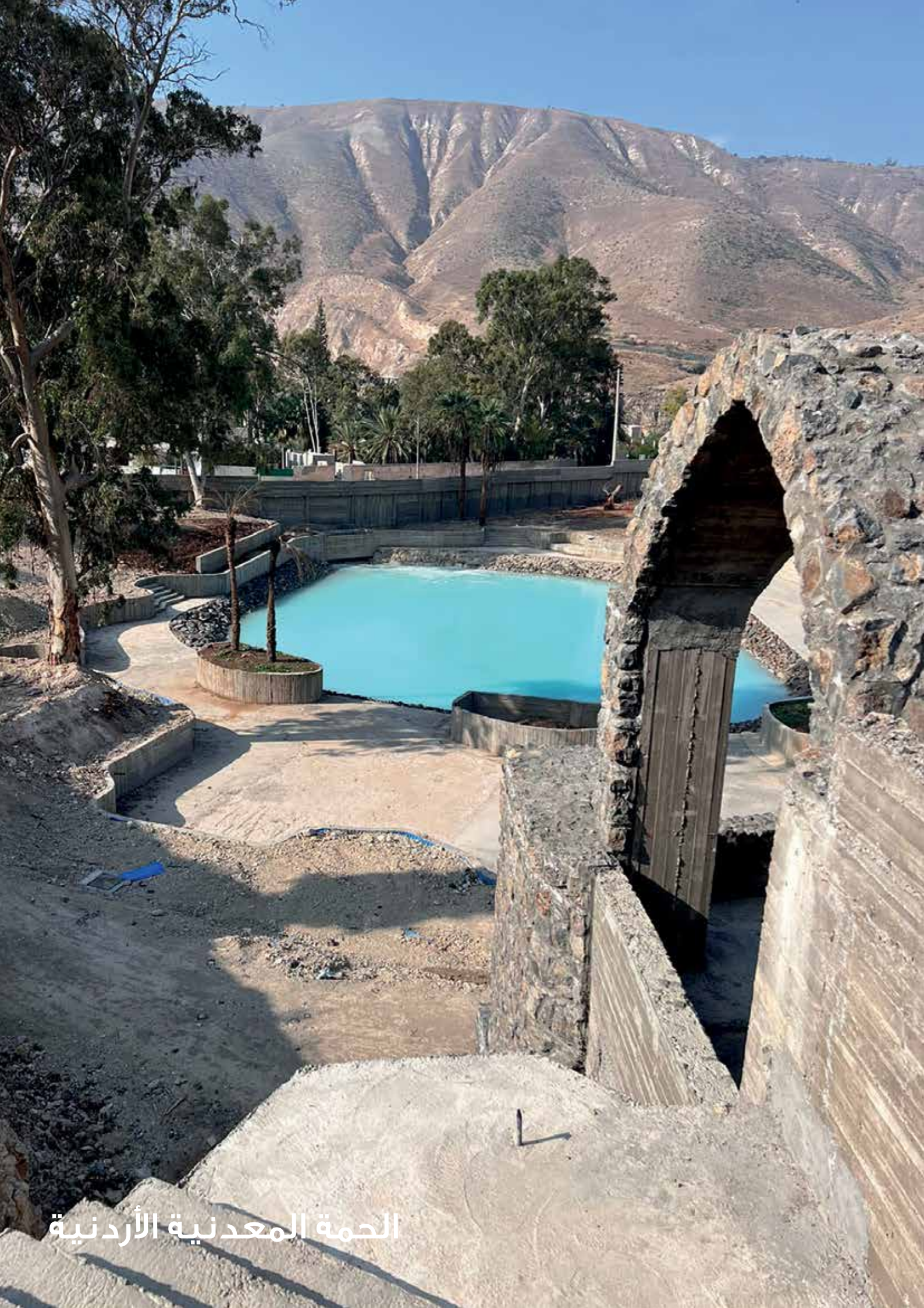
الحمّة المعدنيّة الأردنيّة