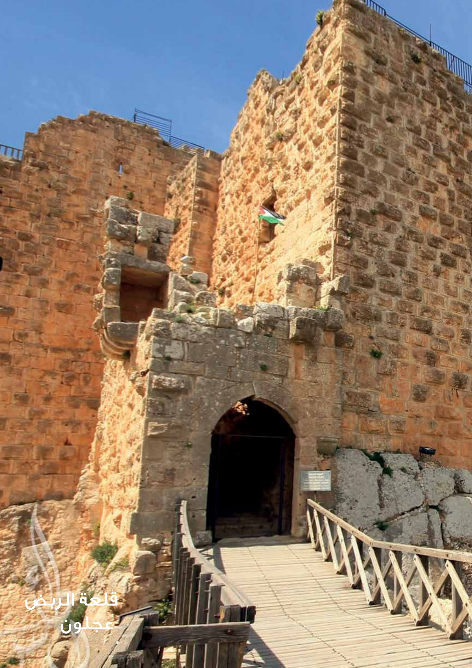
قلعة الربيض عجلون