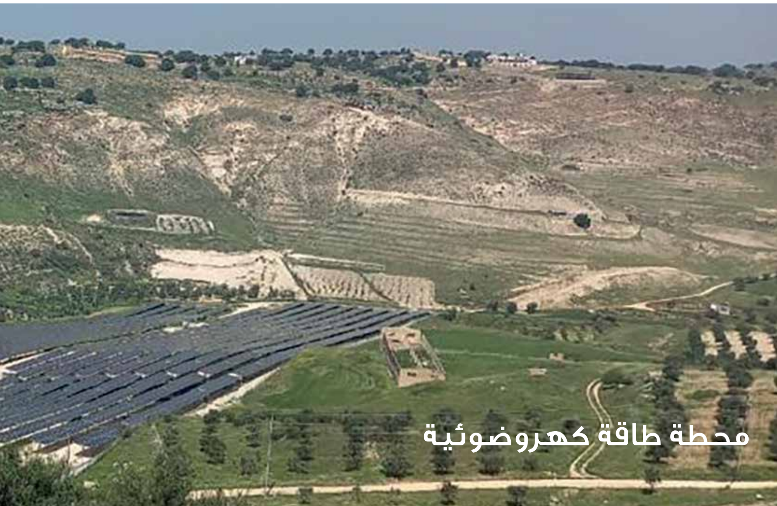
محطة طاقة كهروضوئية