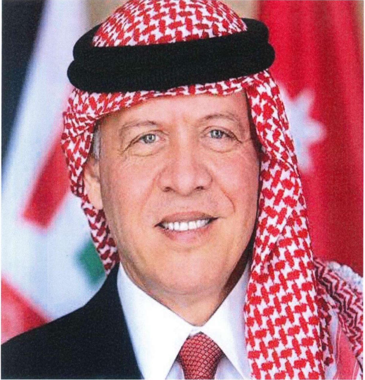
صاحب الجلالة الهاشمية الملك عبدالله الثاني بن الحسين المعظم