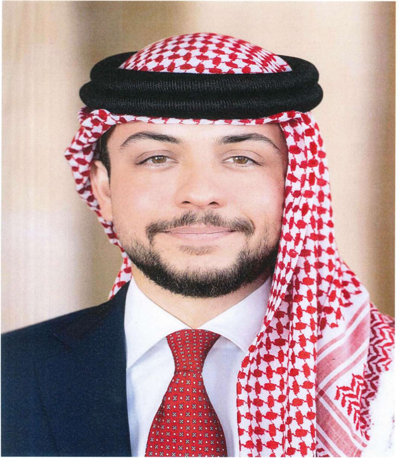
صاحب السمو الملكي ولي العهد الأمير الحسين بن عبدالله الثاني