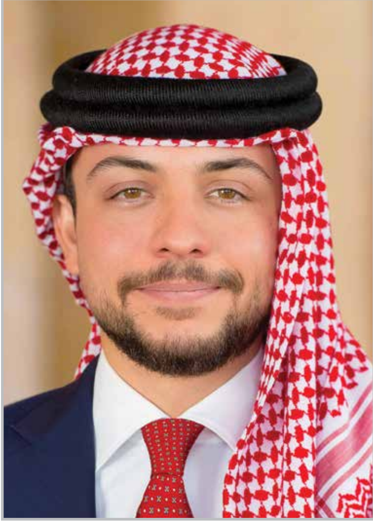
حضرة صاحب السمو الملكي الأمير حسين بن عبد الله الثاني ولي العهد