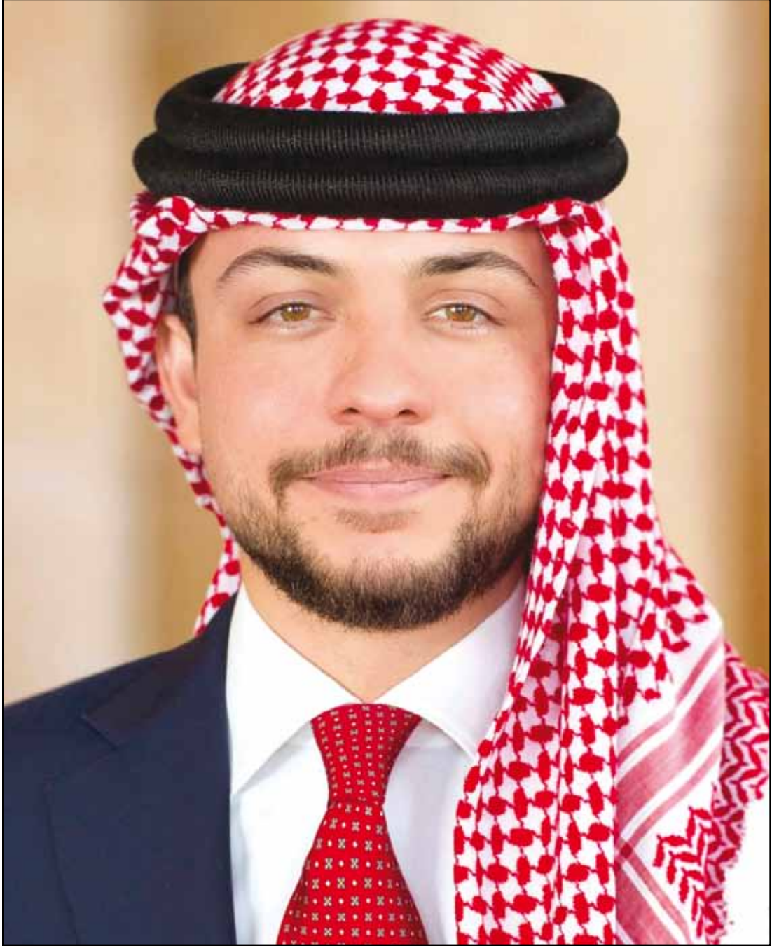
حضرة صاحب السمو الملكي الأمير حسين ابن عبدالله الثاني ولي العهد