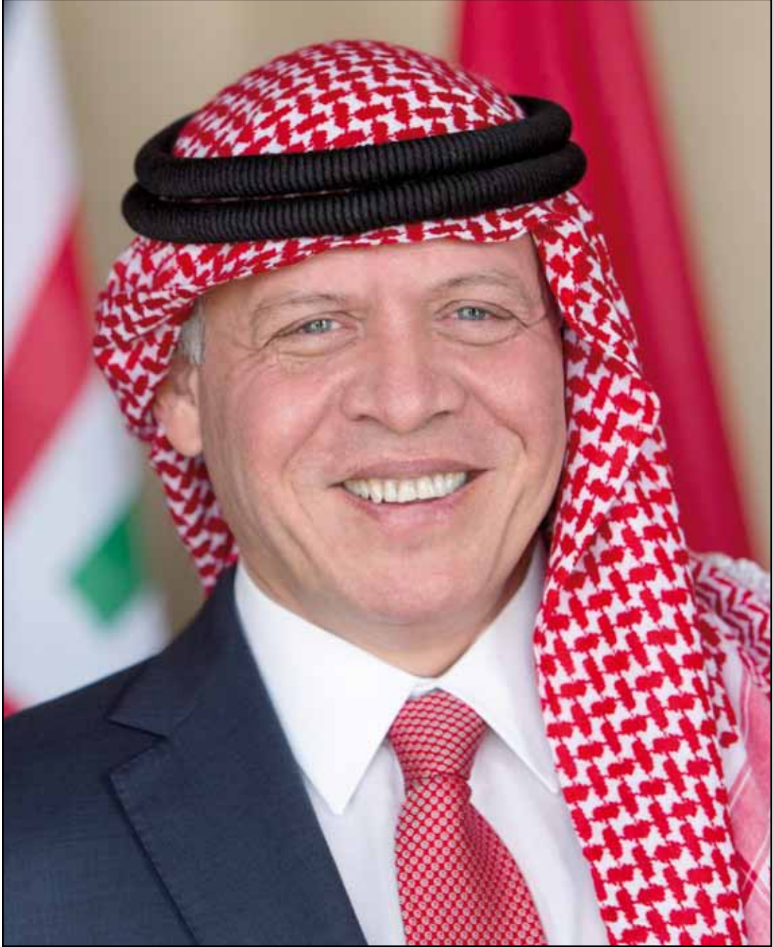
حضرة صاحب الجلالة الملك عبدالله الثاني ابن الحسين المعظم