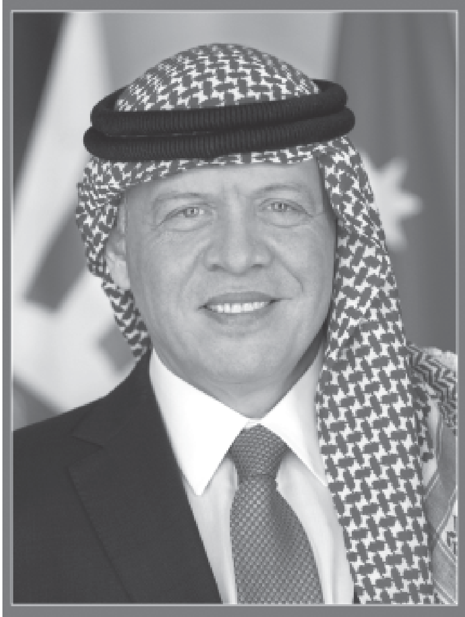
حضرة صاحب الجلالة الملك عبد الله الثاني ابن الحسين المعظم