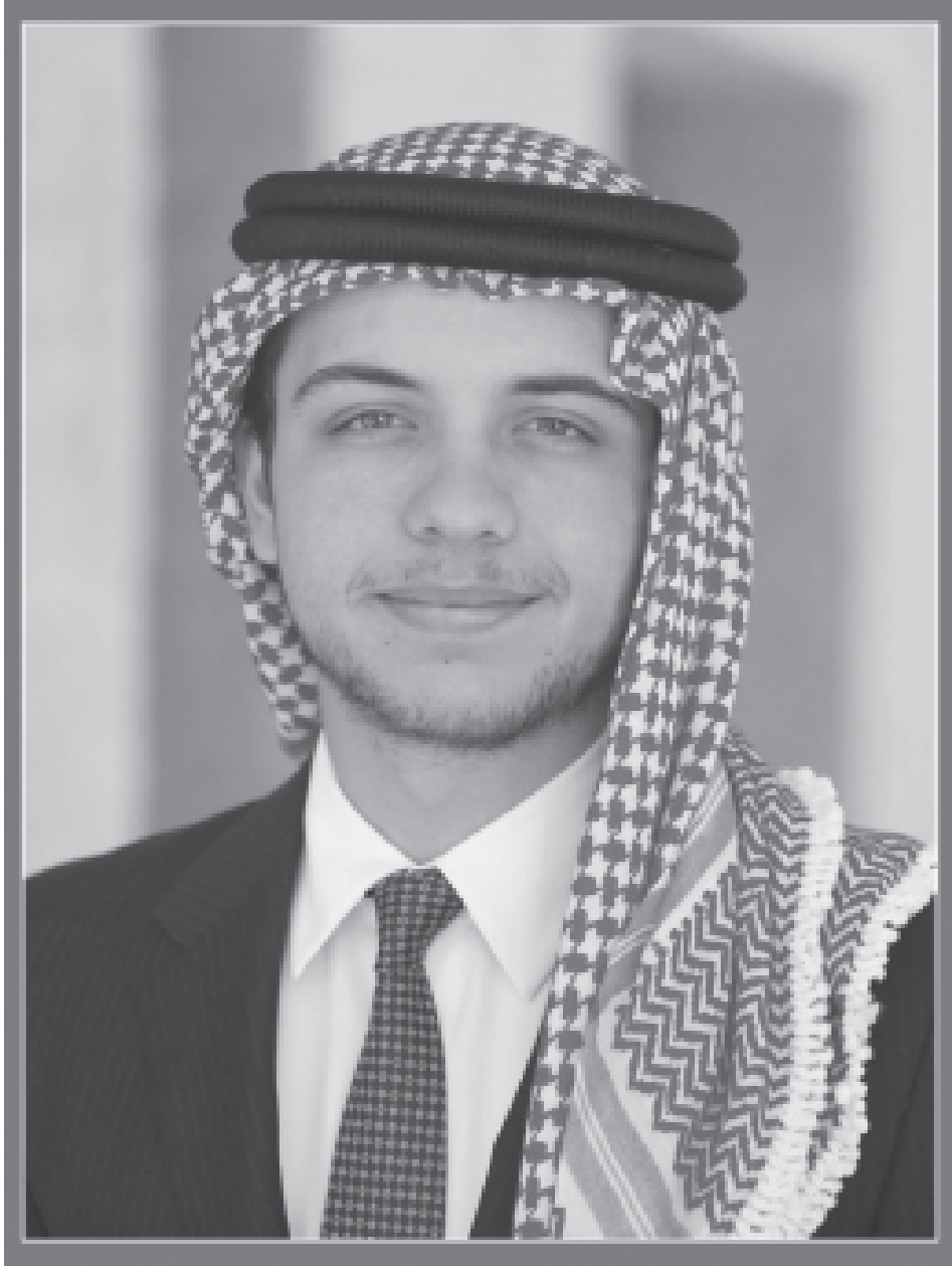
ولاي العهد سمو الأمير الحسين بن عبد الله الثاني