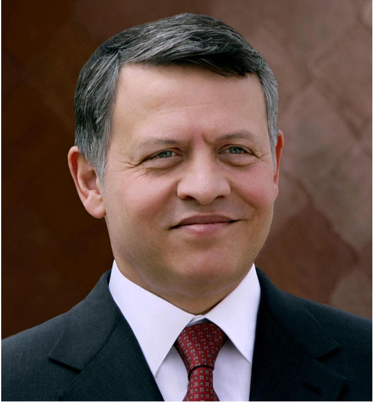
صاحب الجلالة الملك عبدالله بن الحسين المعظم