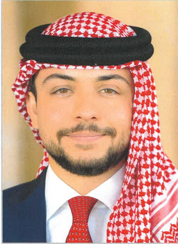
حضرة صاحب السمو الملكي ولي العهد الأمير الحسين بن عبد الله الثاني المعظم