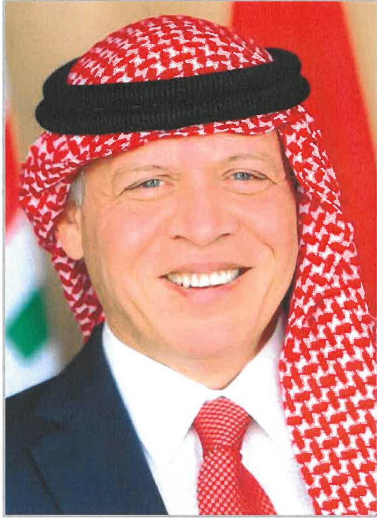
حضرة صاحب الجلالة الهاشمية الملك عبد الله الثاني ابن الحسين المعظم