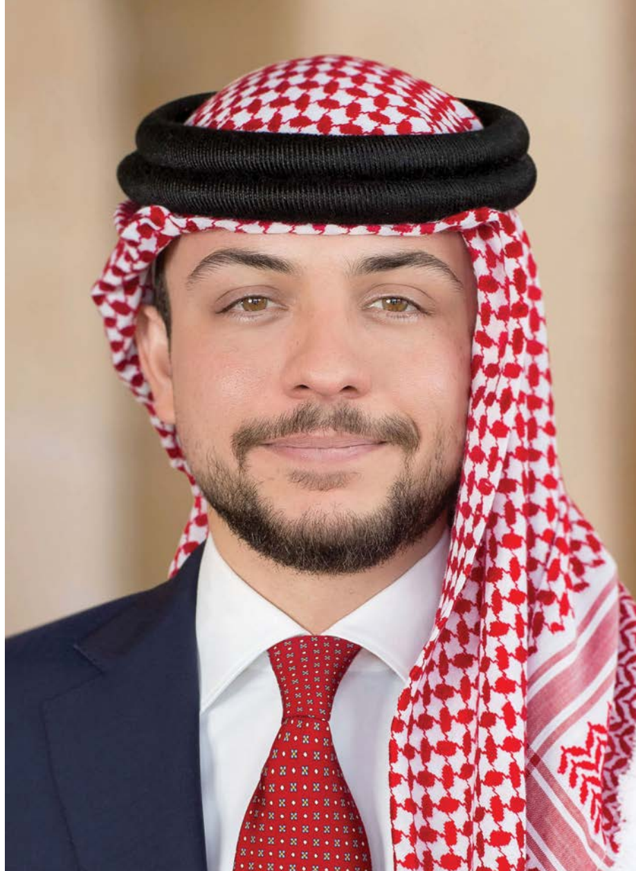
حضرة صاحب السمو الملكي الأمير الحسين بن عبدالله الثاني المعظم ولي العهد