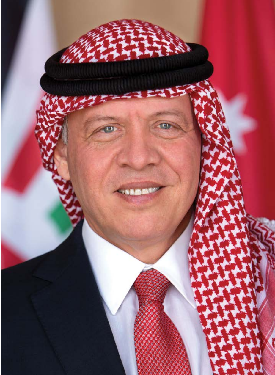
حضرة صاحب الجلالة الهاشمية الملك عبدالله الثاني ابن الحسين المعظم