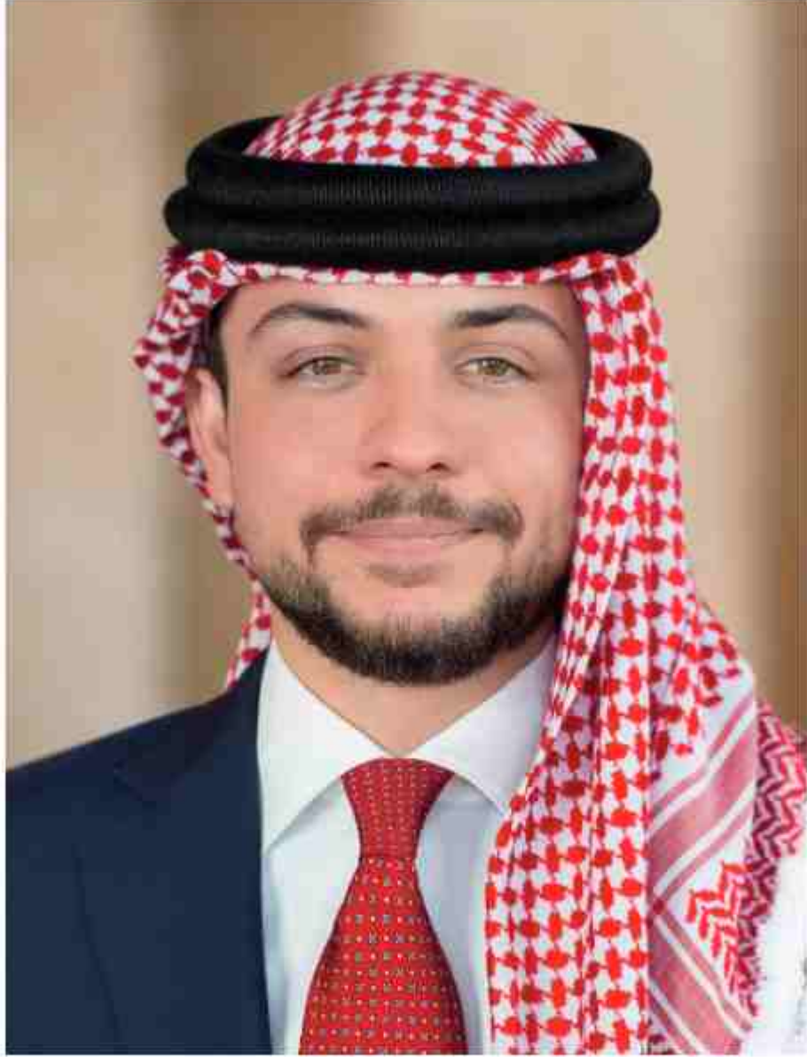
حضرة صاحب السمو الملكي الامير الحسين بن عبد الله الثاني ولي العهد المعظم