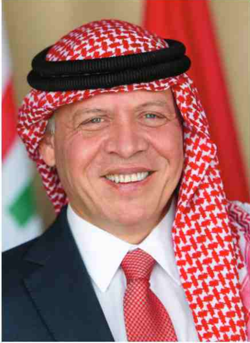
حضرة صاحب الجلالة الملك عبدالله الثاني ابن الحسين حفظه الله ورعاه