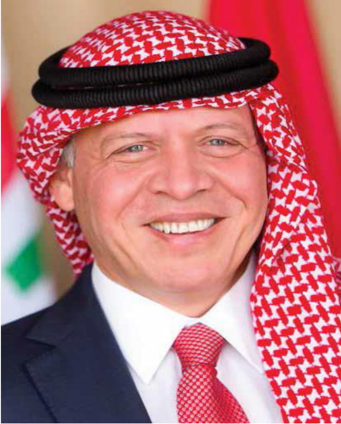
حضرة صاحب الجلالة الملك عبد الله الثاني بن الحسين المعظم (حفظه الله)