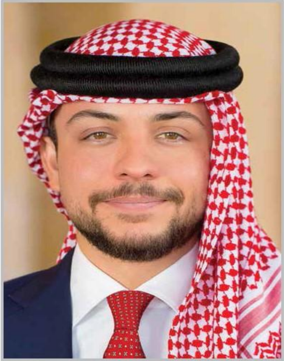
حضرة صاحب السمو الملكي ولي العهد الأمير الحسين بن عبد الله الثاني المعظم