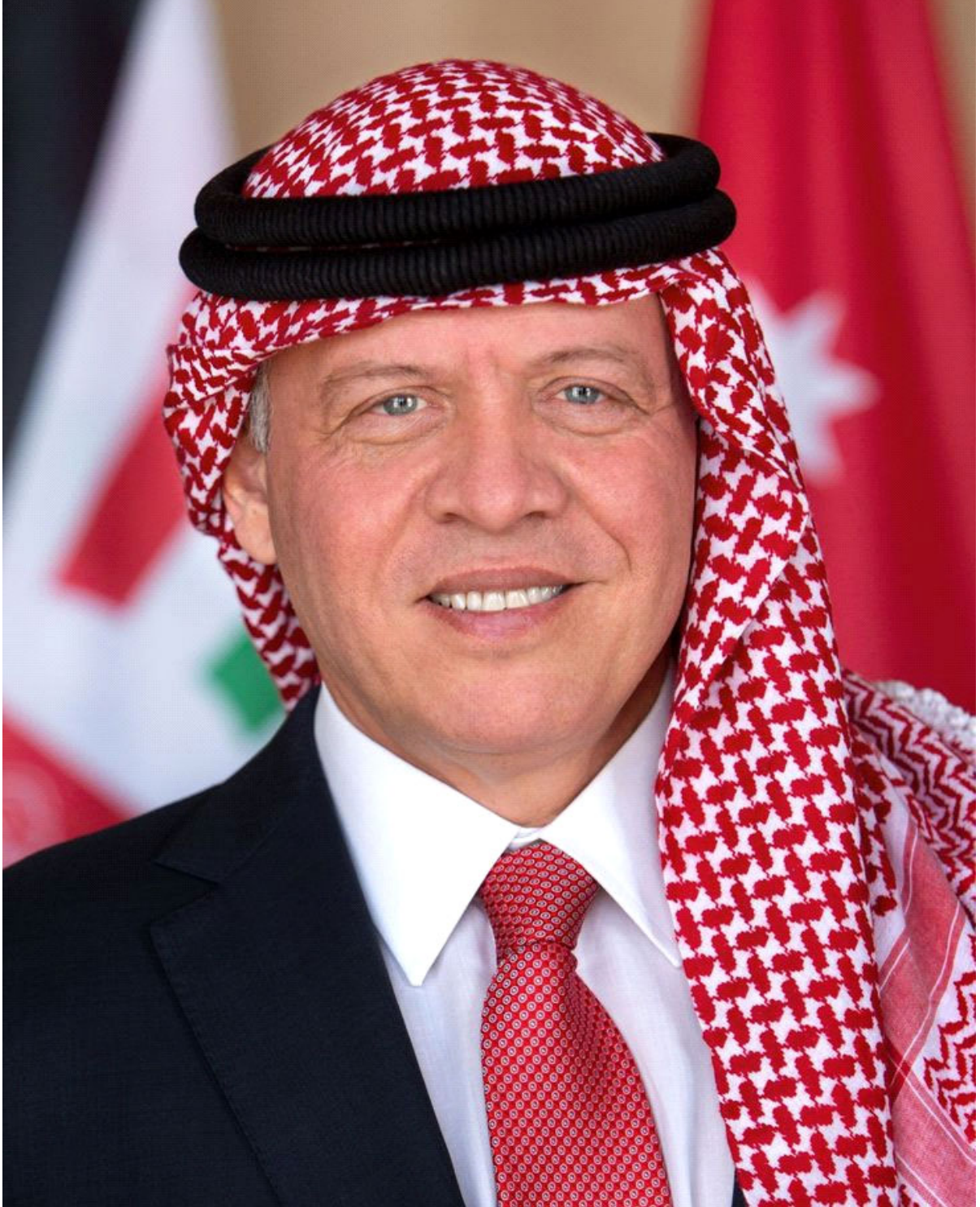
حضرة صاحب الجلالة الهاشمية الملك عبد الله الثاني ابن الحسين المعظم