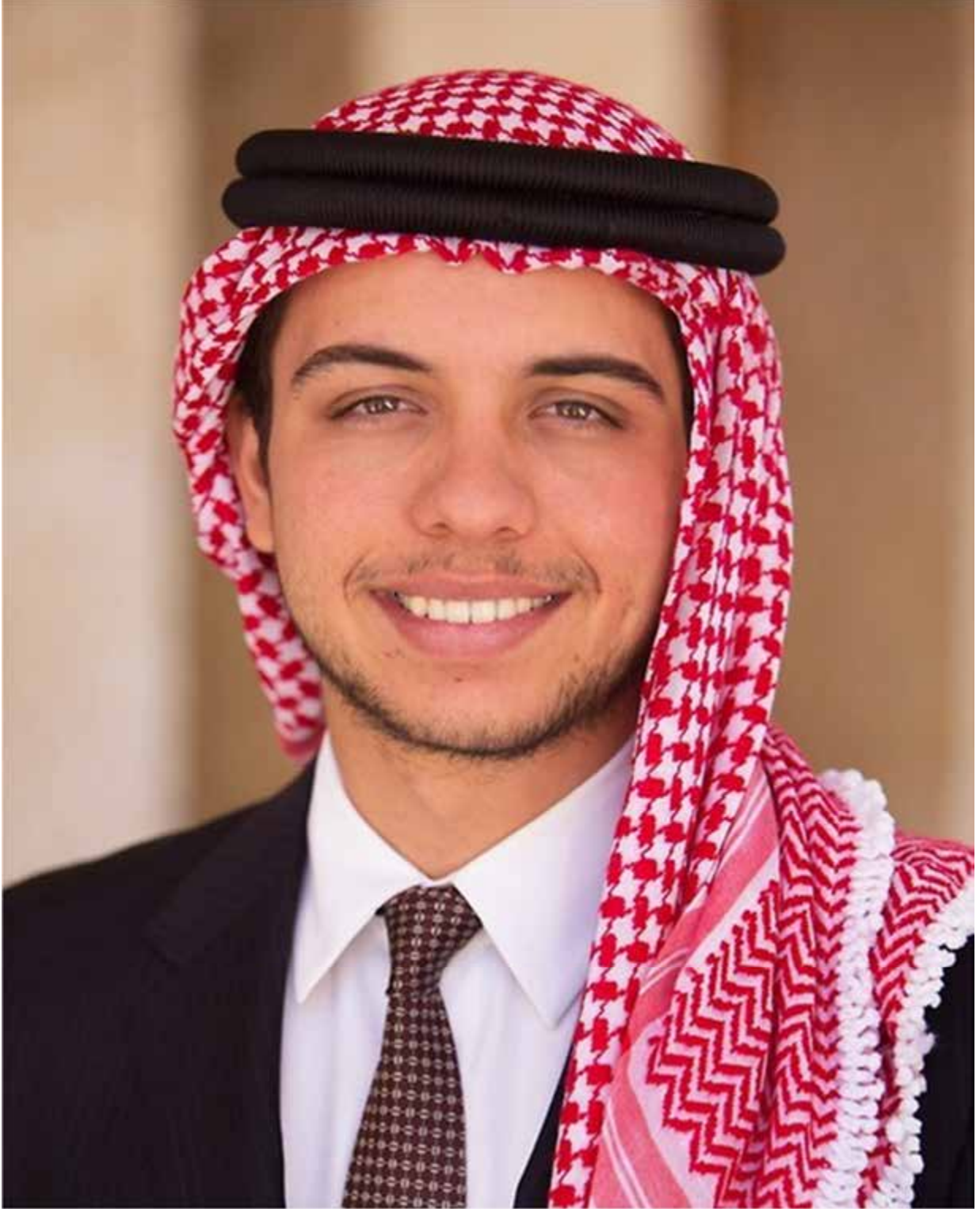
ولي العهد سمو الأمير الحسين بن عبد الله الثاني المعظم