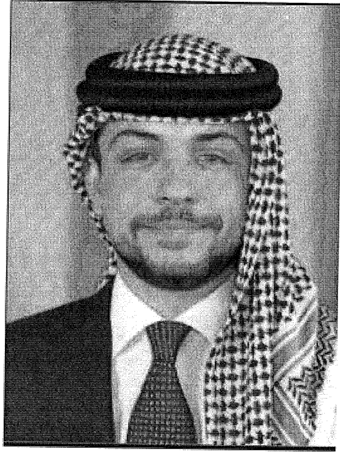
حضرة صاحب السمو الملكي الحسين بن عبد الله الثاني ولي العهد