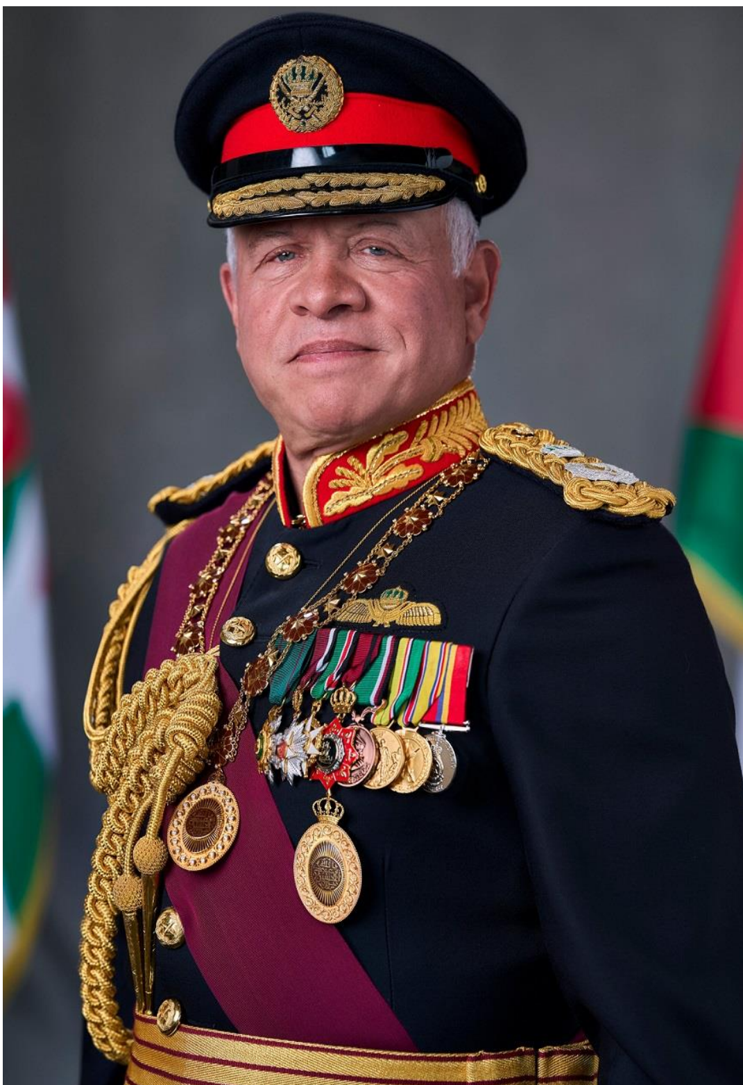
حضرة صاحب الجلالة الهاشمية الملك عبد الله الثاني بن الحسين المعظم