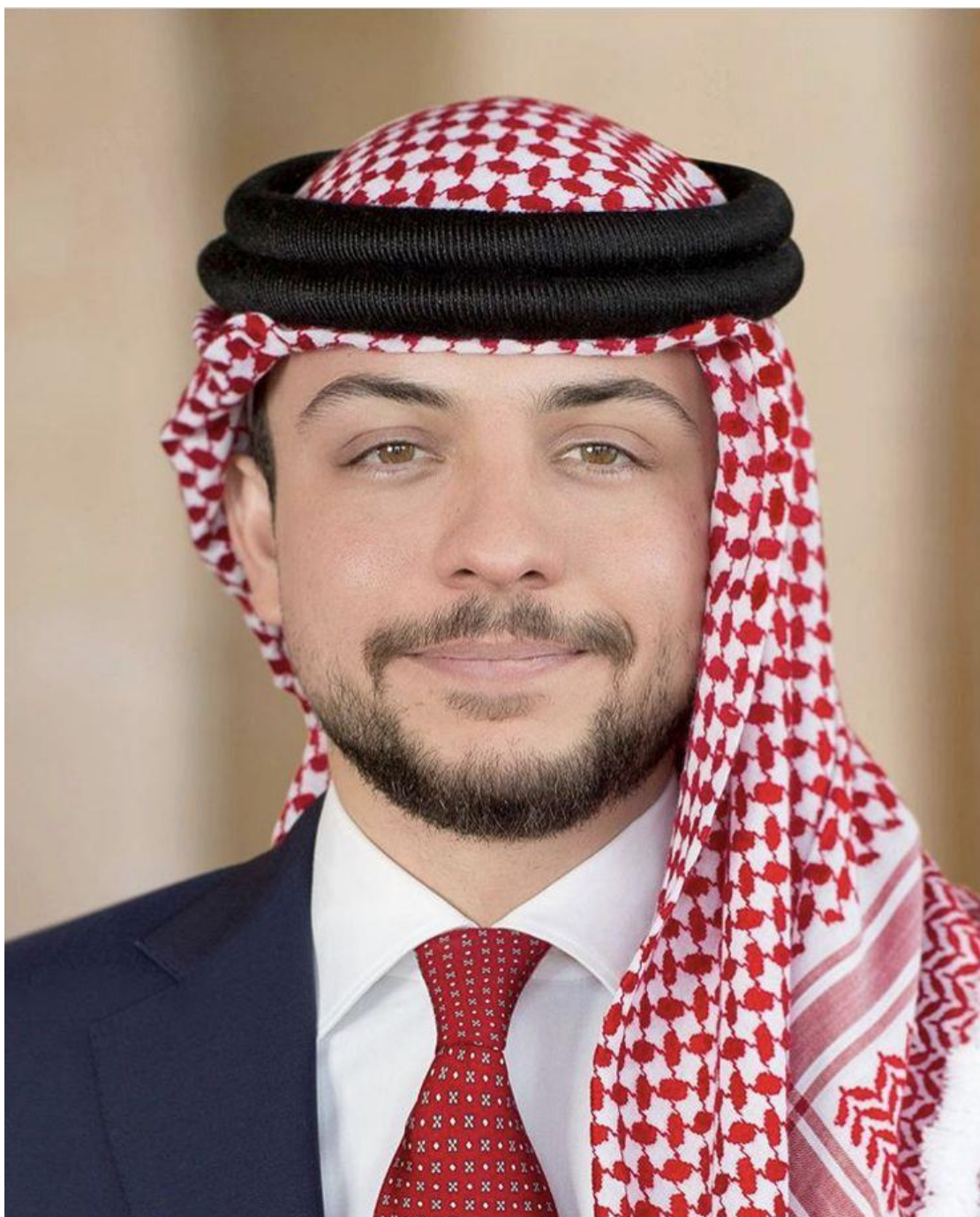
حضرة صاحب السمو الملكي ولي العهد الأمير الحسين بن عبد الله الثاني المعظم