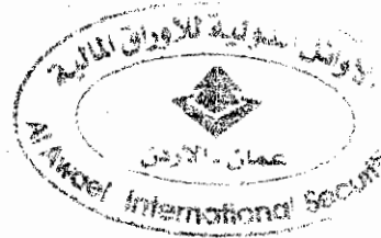
دانا العقيفي ضابط الامتثال