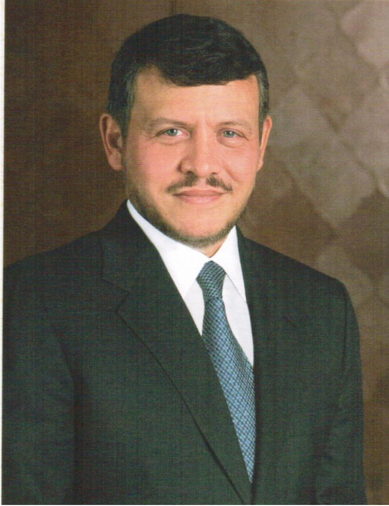
حضرة صاحب الجلالة الملك عبد الله الثاني بن الحسين المعظم