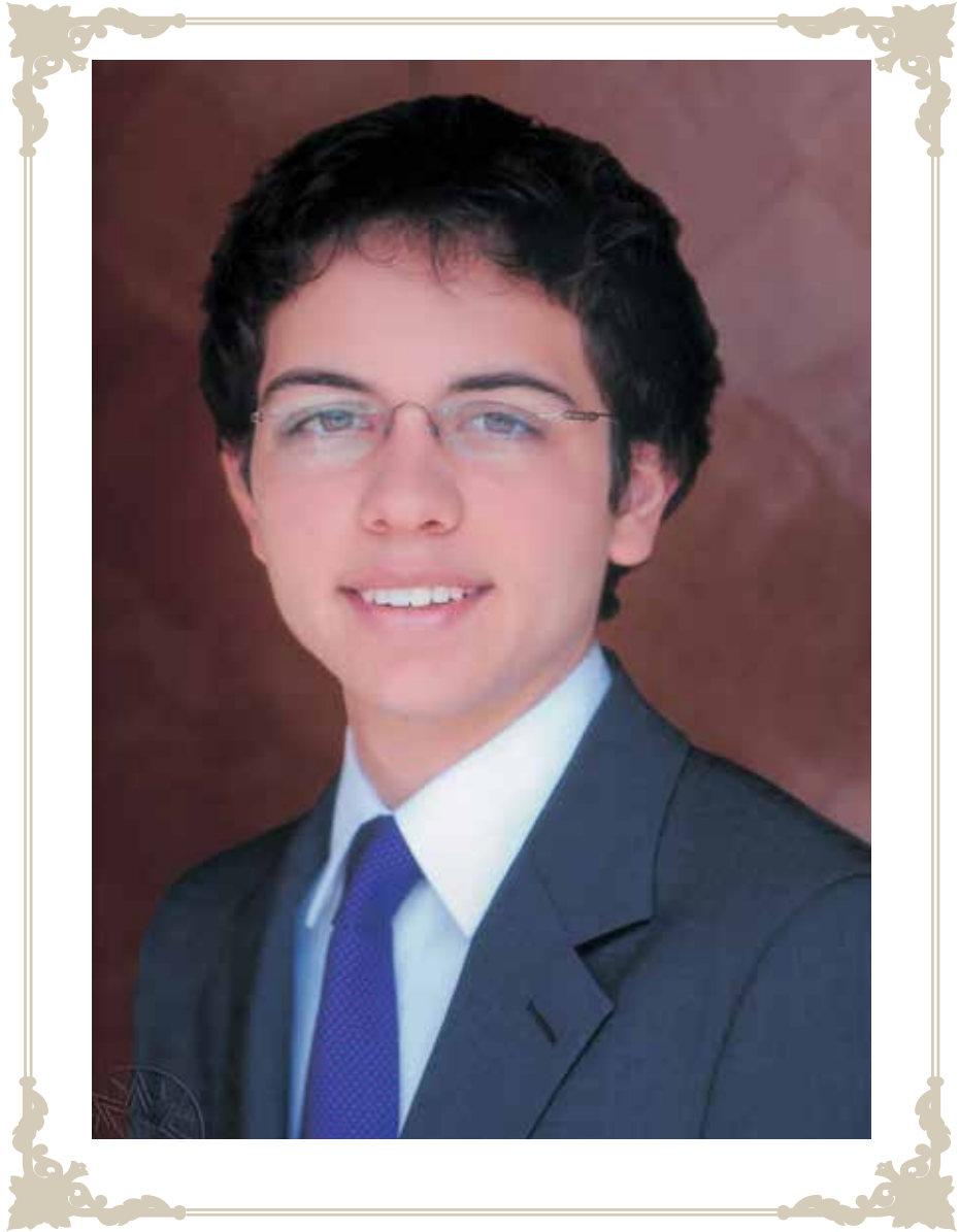
صاحب السمو الملكي الأمير حسين بن عبد الله الثاني ولي العهد