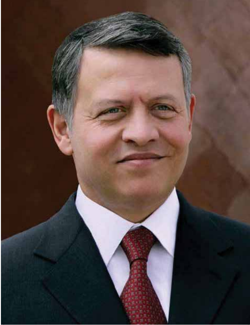
صاحب الجلالة الملك عبد الله الثاني بن الحسين