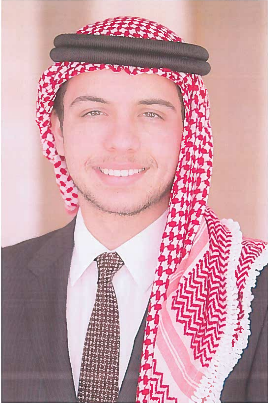
حضرة ولي العهد الحسين ابن عبدالله الثاني حفظه الله و رعاه