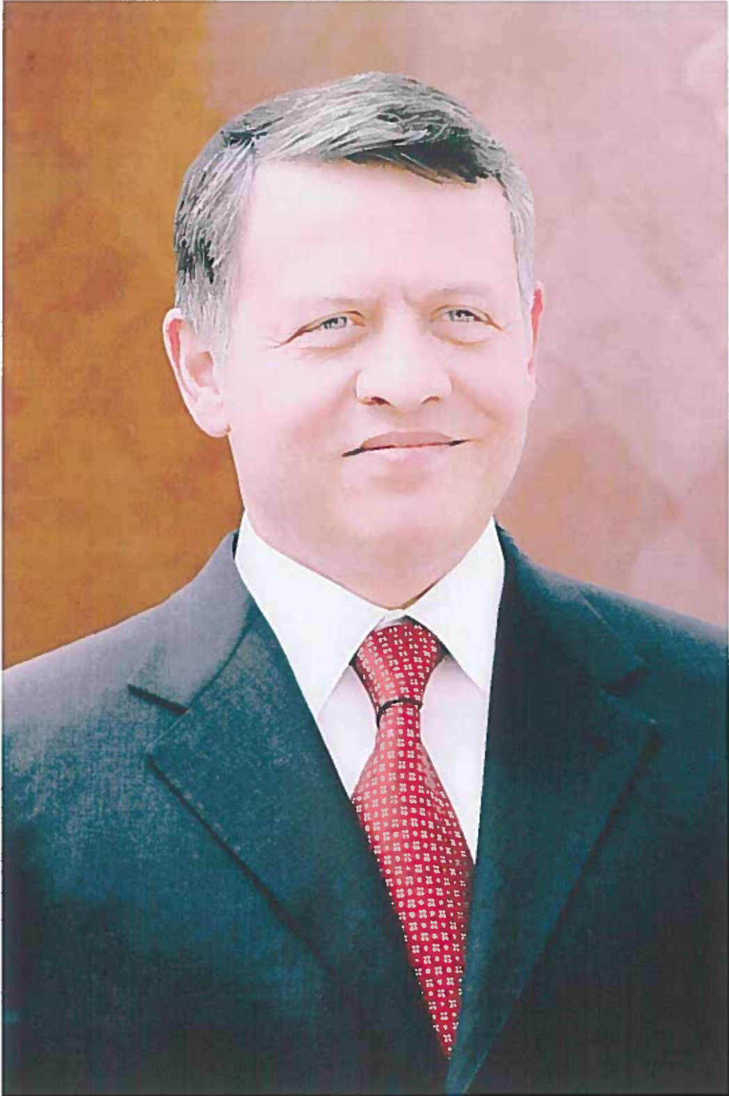
حضرة صاحب الجلالة الملك عبدالله الثاني بن الحسين حفظه الله و رعاه