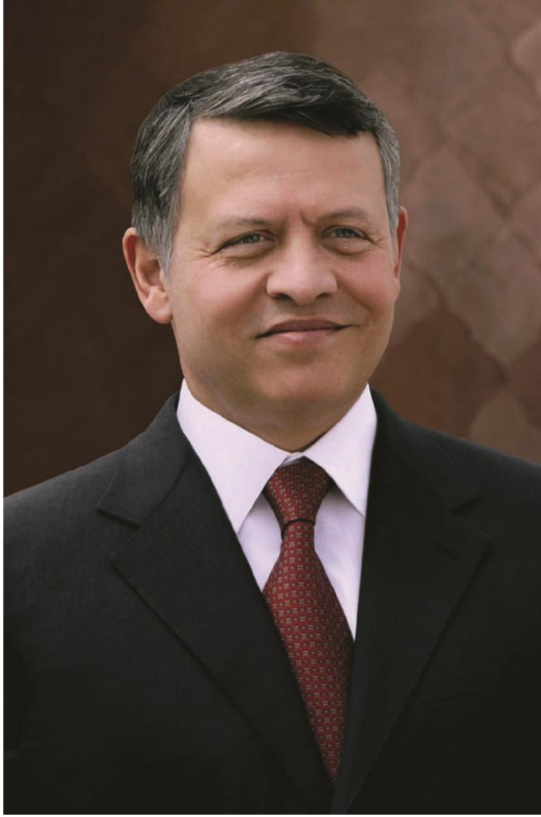
حضرة صاحب الجلالة الهاشمية الملك عبد الله الثاني ابن الحسين المعظم