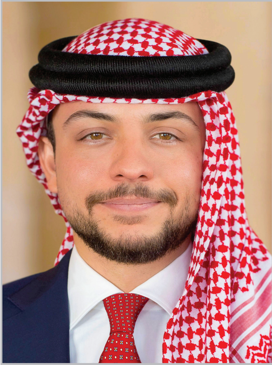
حضرة صاحب السمو الملكي الأمير الحسين بن عبد الله الثاني ولي العهد المعظم