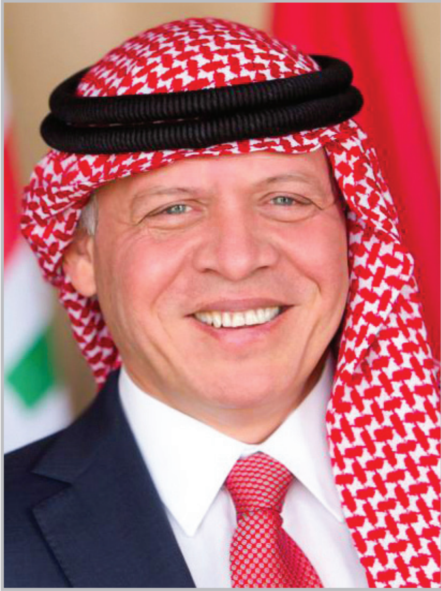
حضرة صاحب الجلالة الملك عبد الله الثاني بن الحسين المعظم