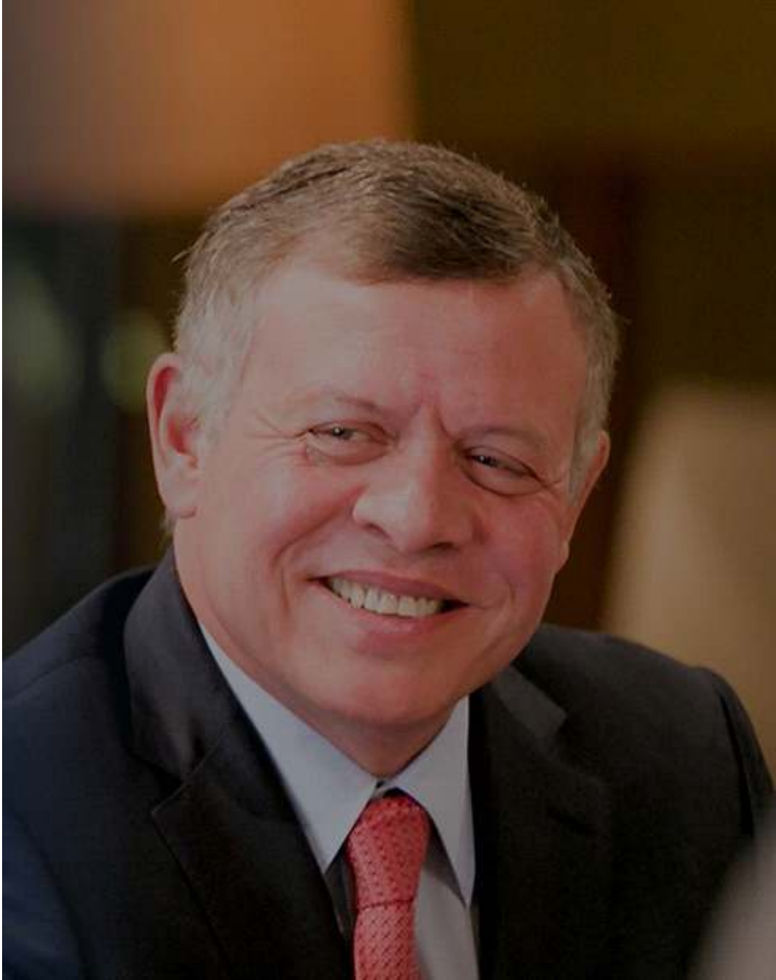
صاحب الجلالة الهاشمية الملك عبدالله الثاني بن الحسين المعظم