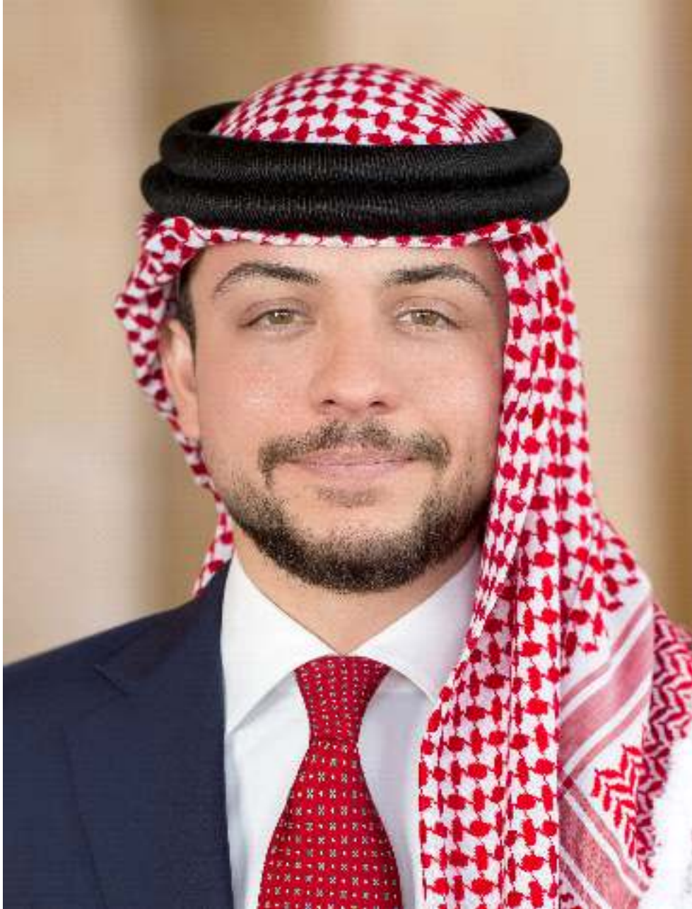
ولي العهد سمو الأمير حسين بن عبد الله الثاني المعظم