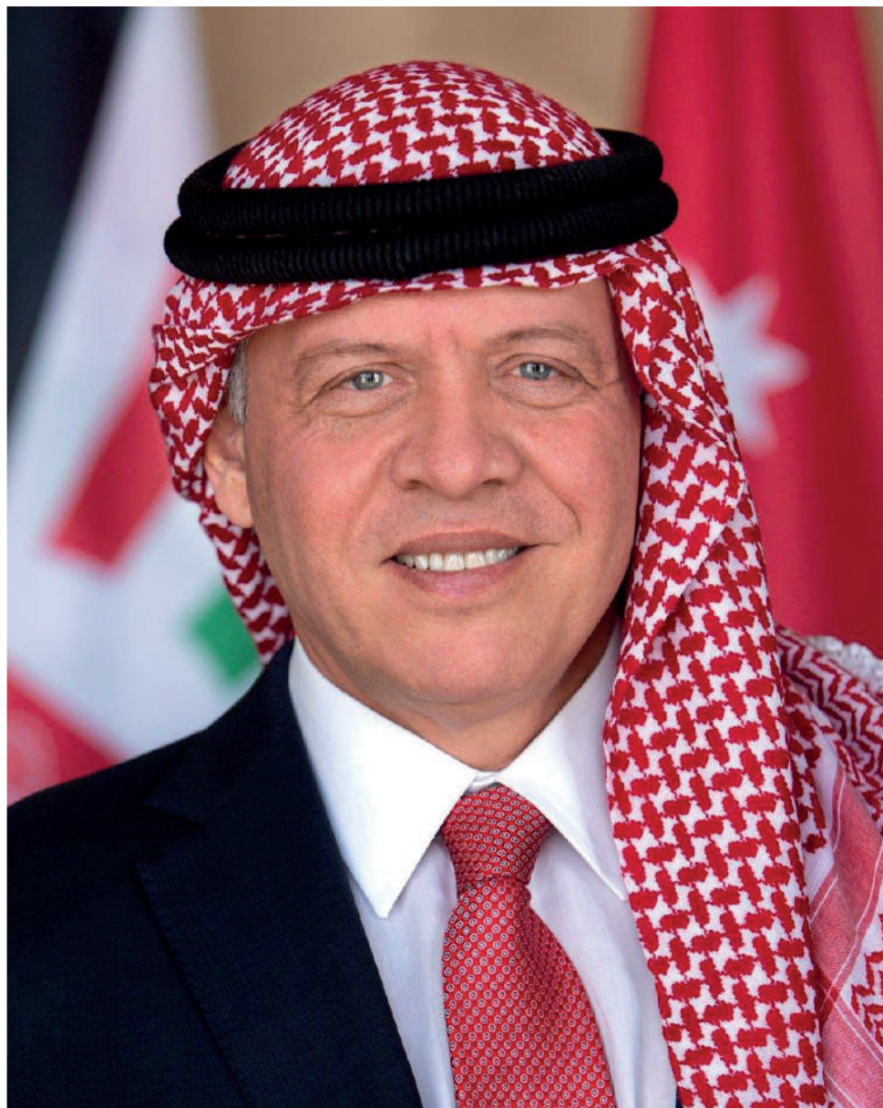
حضرة صاحب الجلالة الملك عبدالله الثاني بن الحسين المعظم