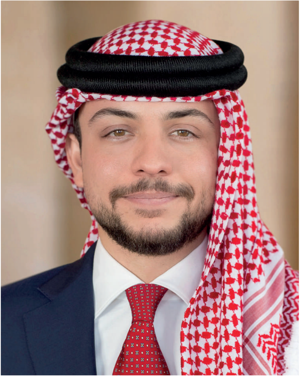
ولي العهد الامير حسين بن عبدالله الثاني