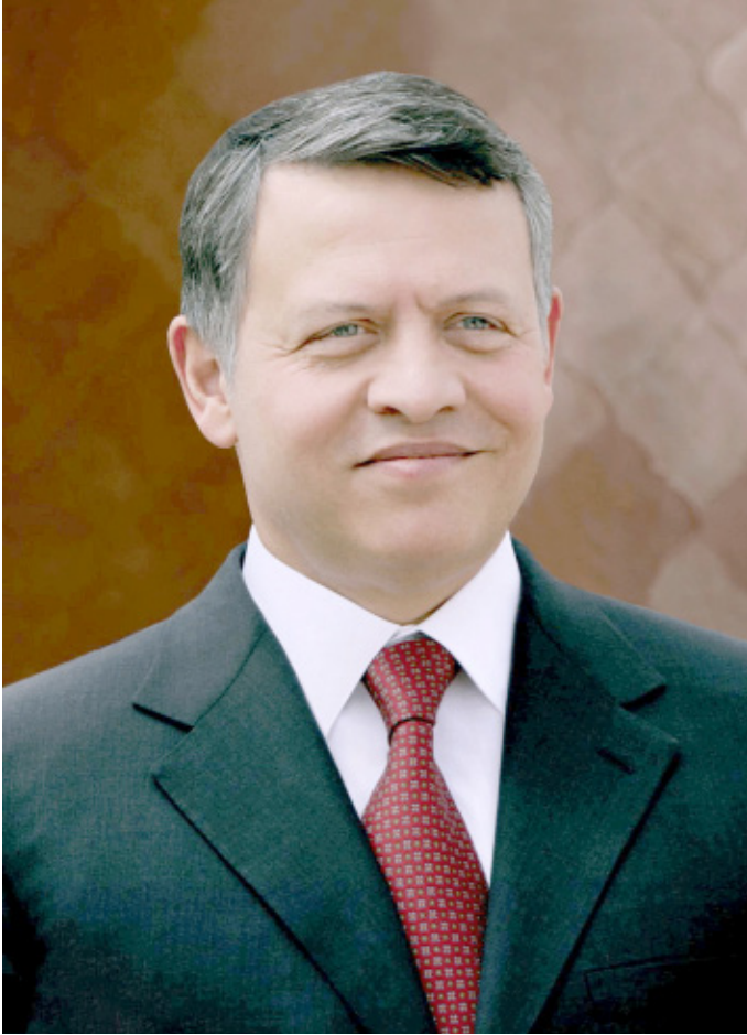
حضرة صاحب الجلالة الملك عبد الله الثاني بن الحسين حفظه الله ورعاه