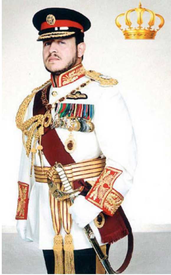
حضرة صاحب الجلالة الملك عبدالله الثاني بن الحسين المعظم