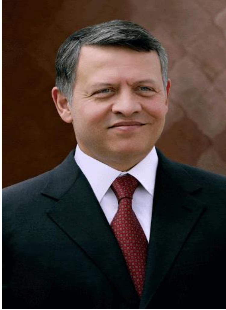
جلالة الملك عبدالله الثاني ابن الحسين المعظم