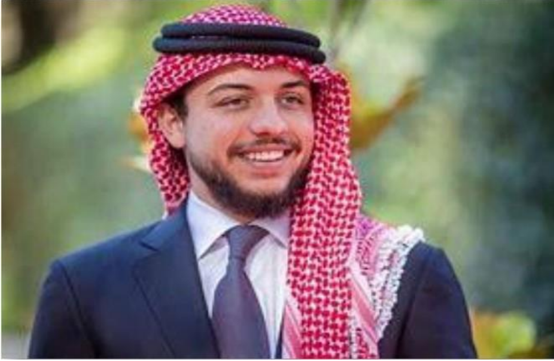
حضرة صاحب السمو الملكي الأمير الحسين بن عبدالله الثاني ولي العهد