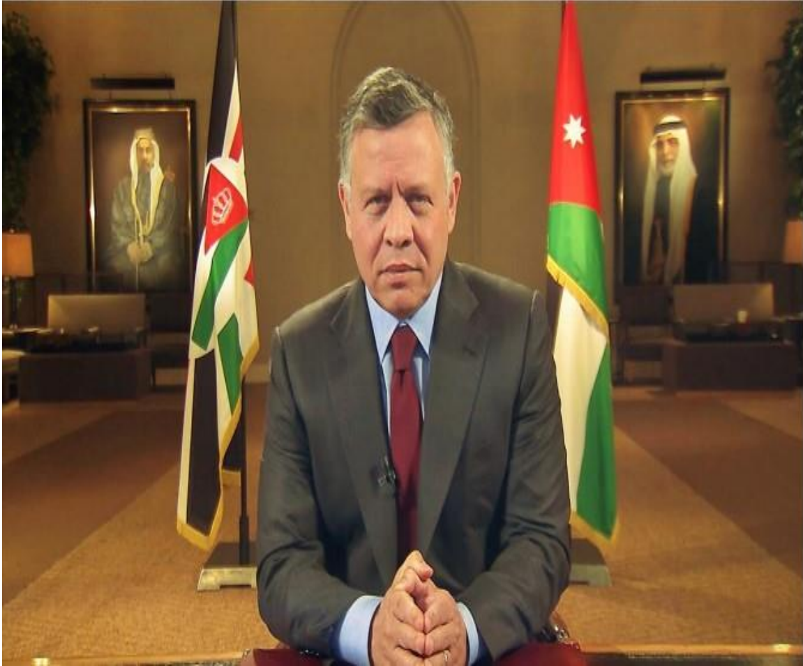
حضرة صاحب الجلالة الملك عبدالله الثاني بن الحسين المعظم