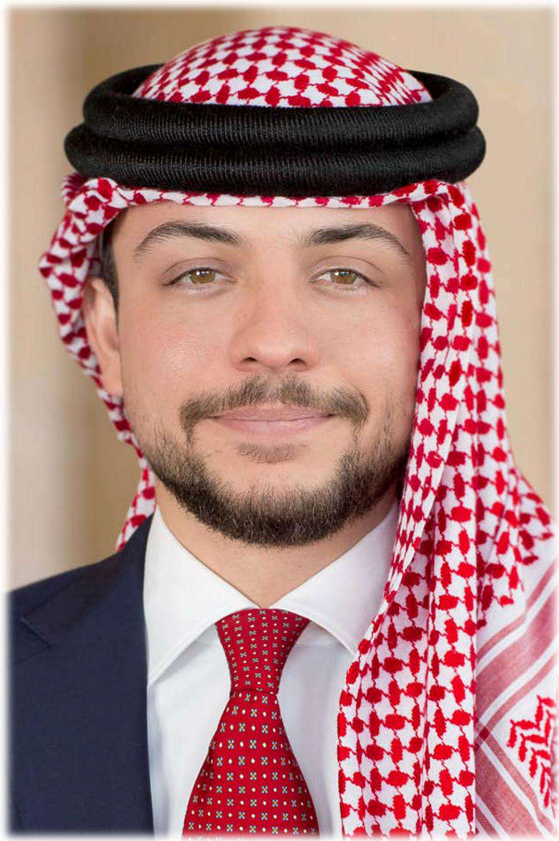
صاحب السمو الملكي الأمير الحسين بن عبدالله الثاني ولي العهد المعظم