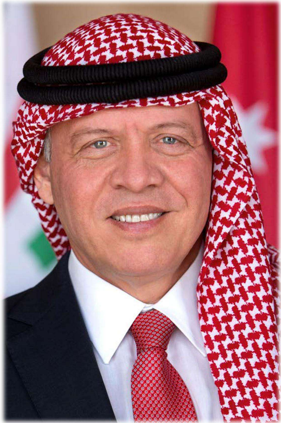
حضرة صاحب الجلالة الهاشمية الملك عبدالله الثاني بن الحسين المعظم