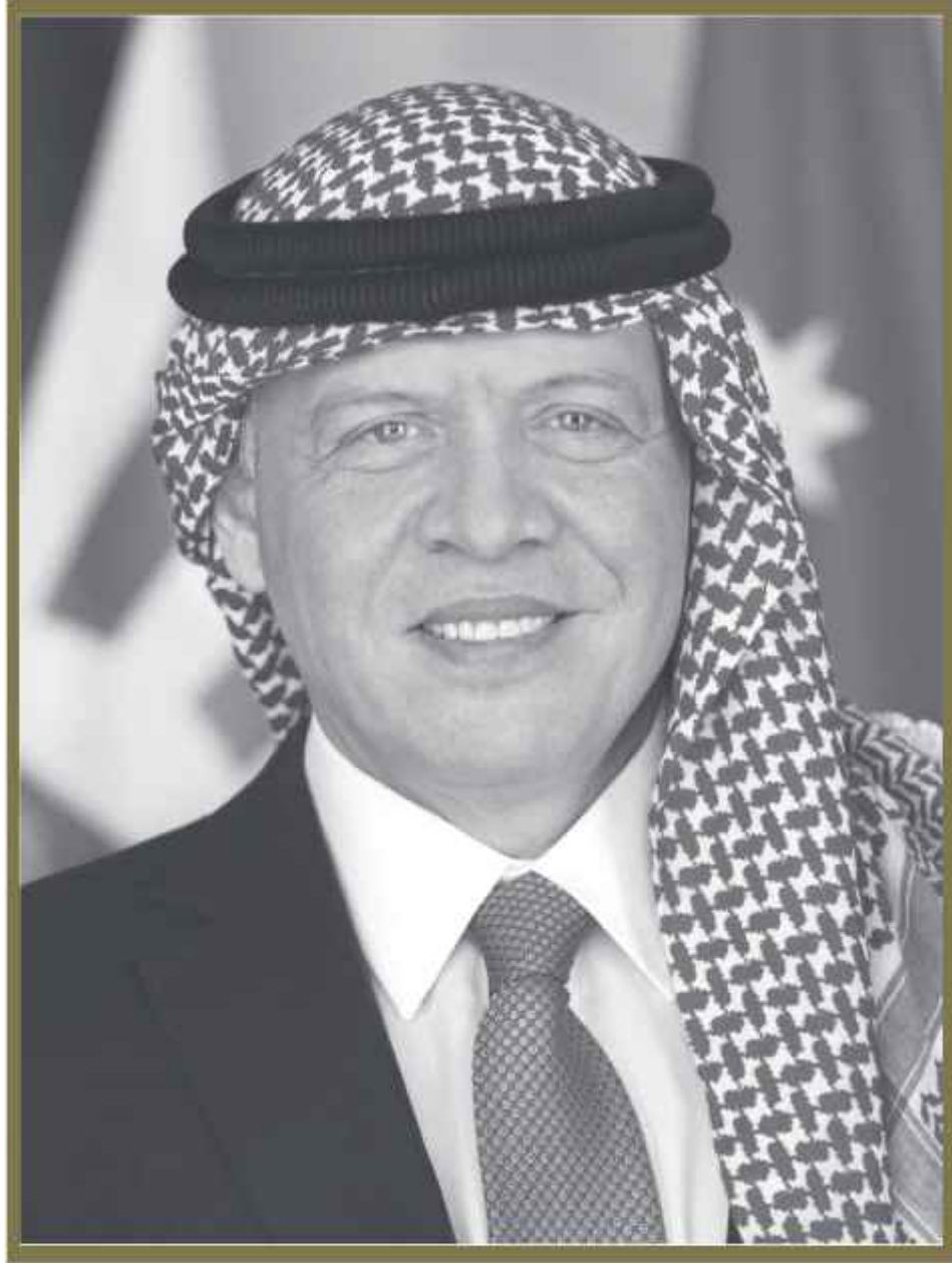
حضرة صاحب الجلالة الملك عبد الله الثاني ابن الحسين المعظم