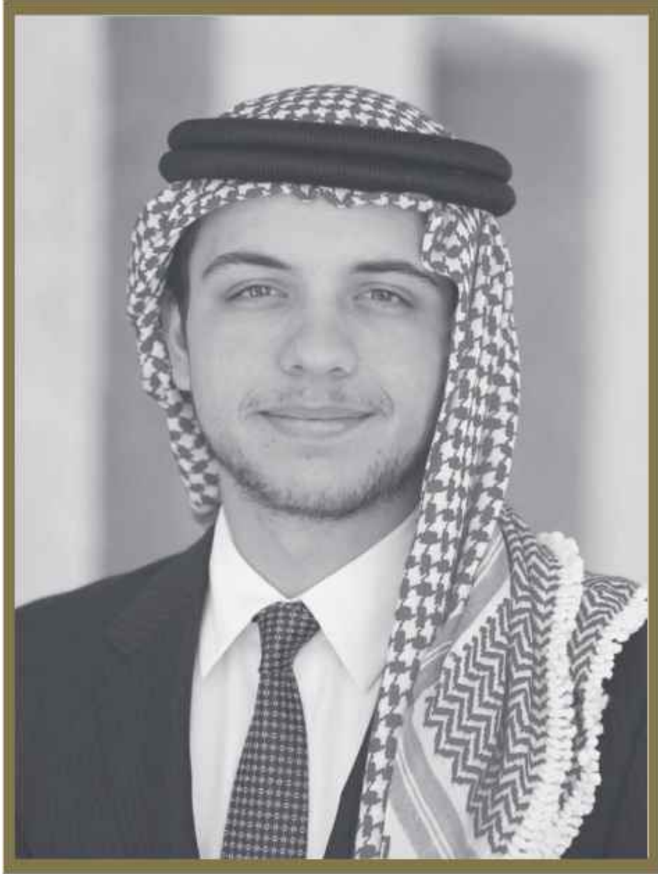
ولاي العهد سمو الأمير الحسين بن عبد الله الثاني