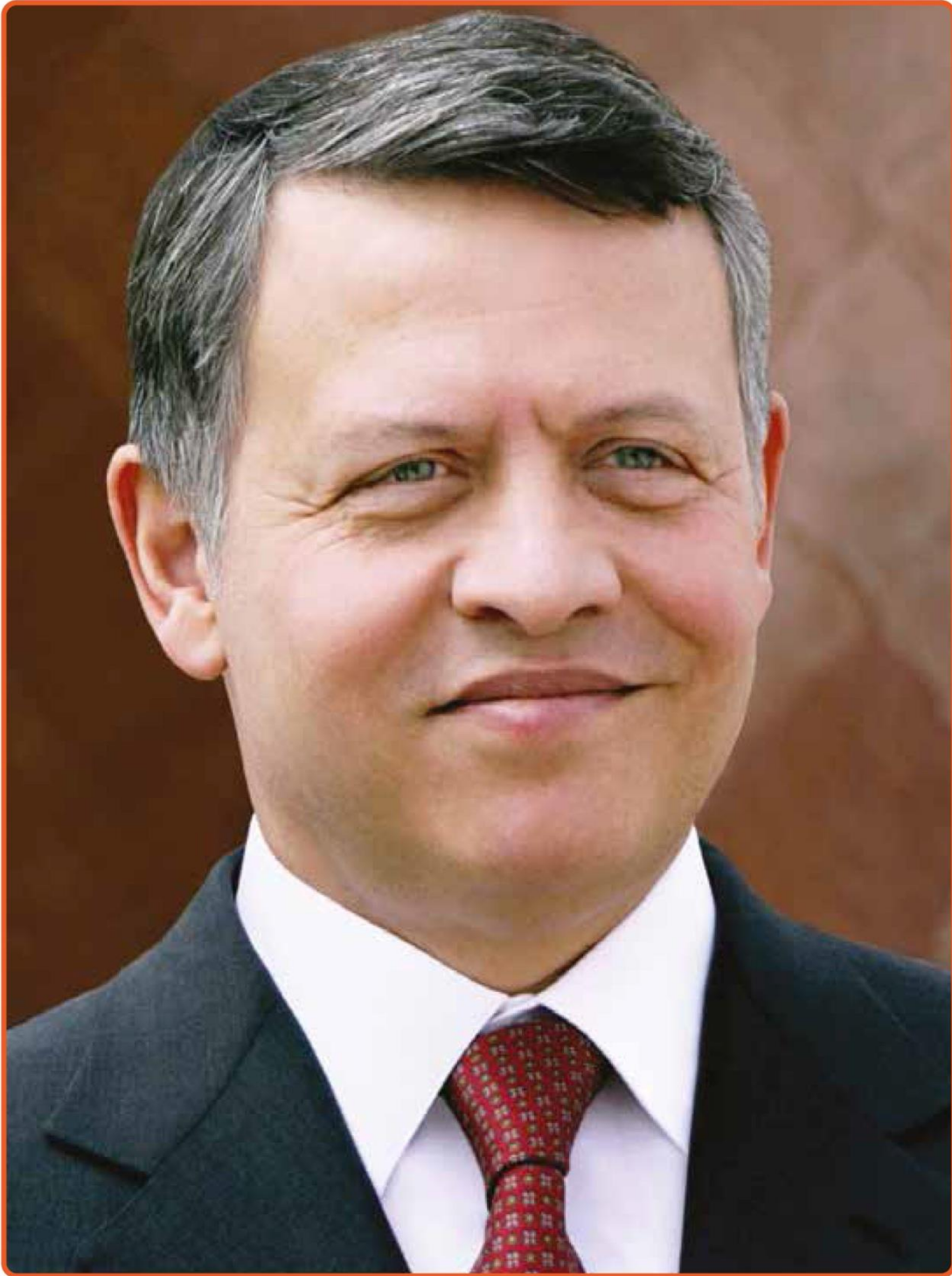
صاحب الجلالة الملك عبد الله الثاني بن الحسين المعظم