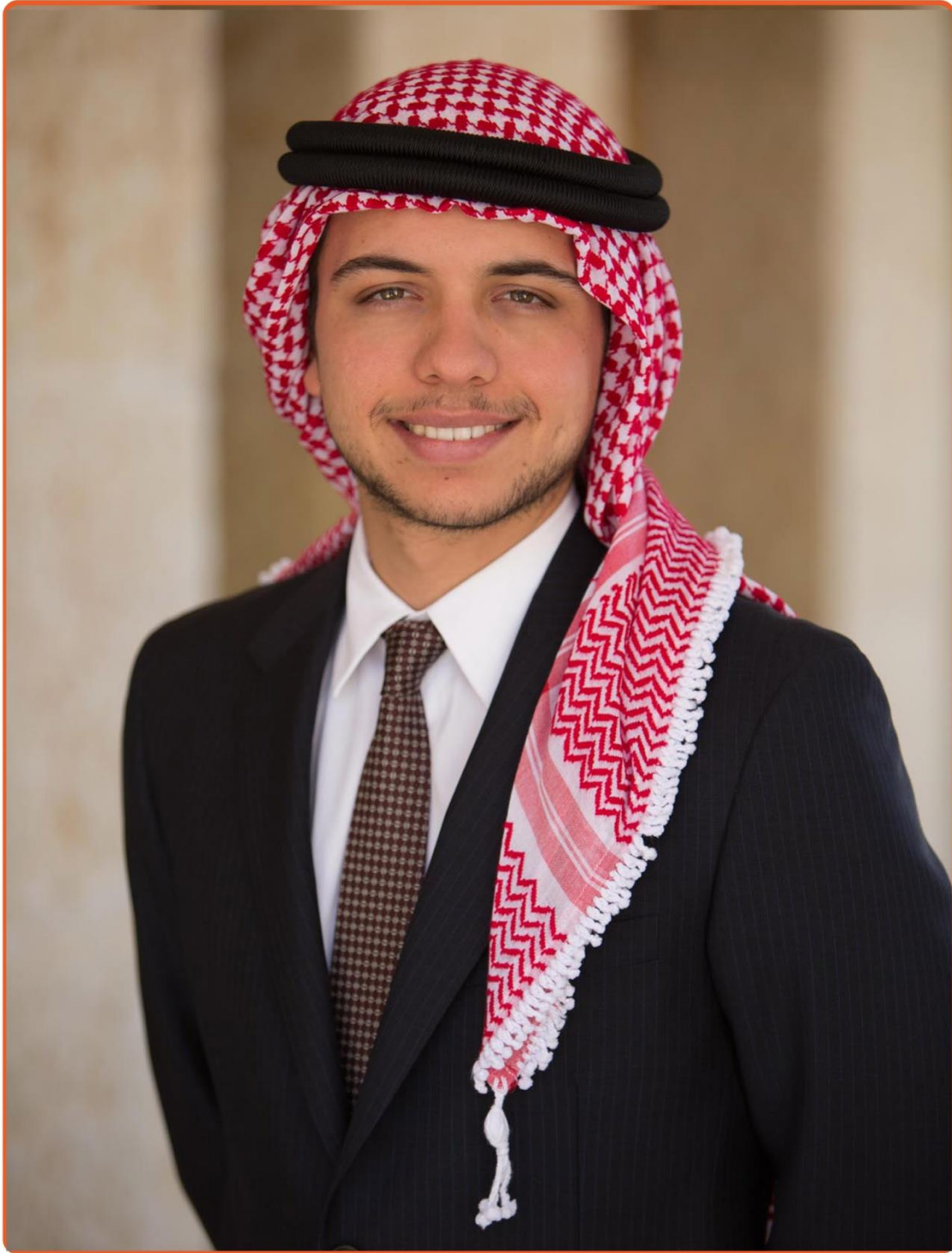
ولي العهد صاحب السمو الملكي الامير الحسين بن عبد الله الثاني بن الحسين المعظم