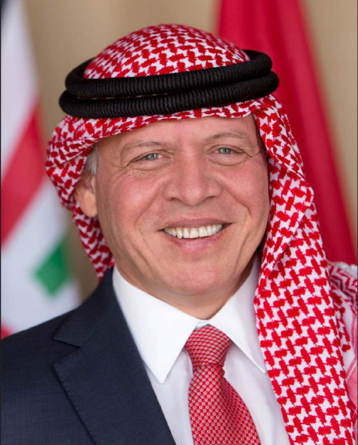
حضرة صاحب الجلالة الملك عبدالله الثاني ابن الحسين المعظم