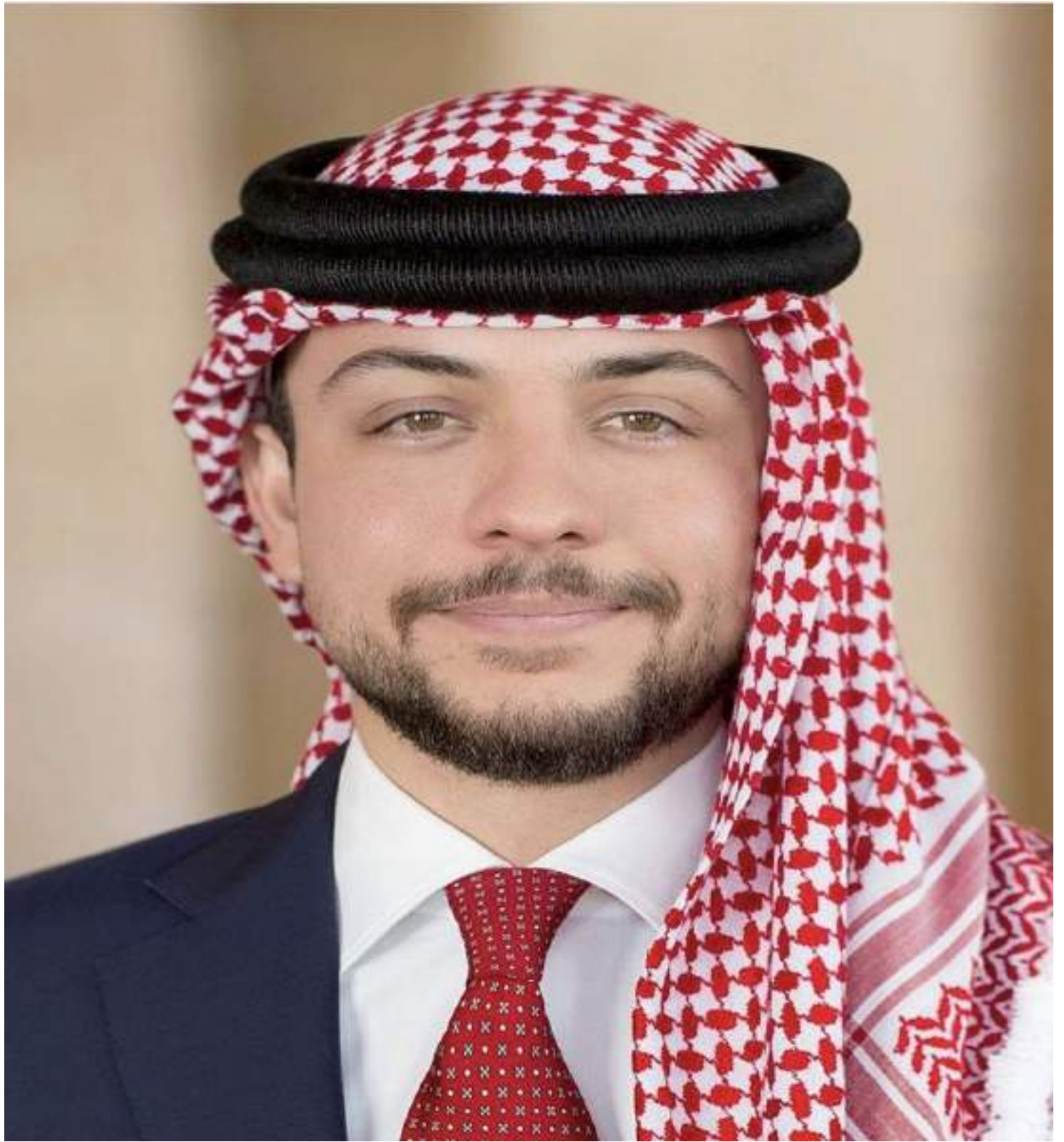
حضرة صاحب السمو الملكي الأمير الحسين بن عبد الله ولي العهد المعظم