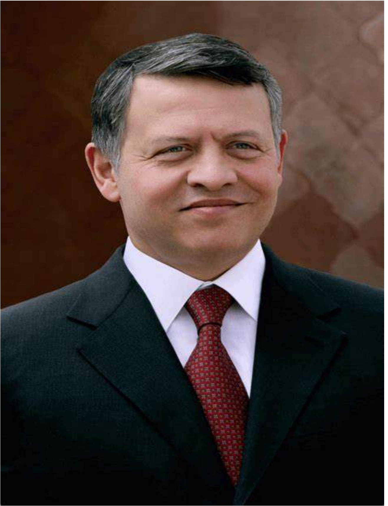
حضرة صاحب الجلالة الهاشمية الملك عبد الله الثاني بن الحسين المعظم