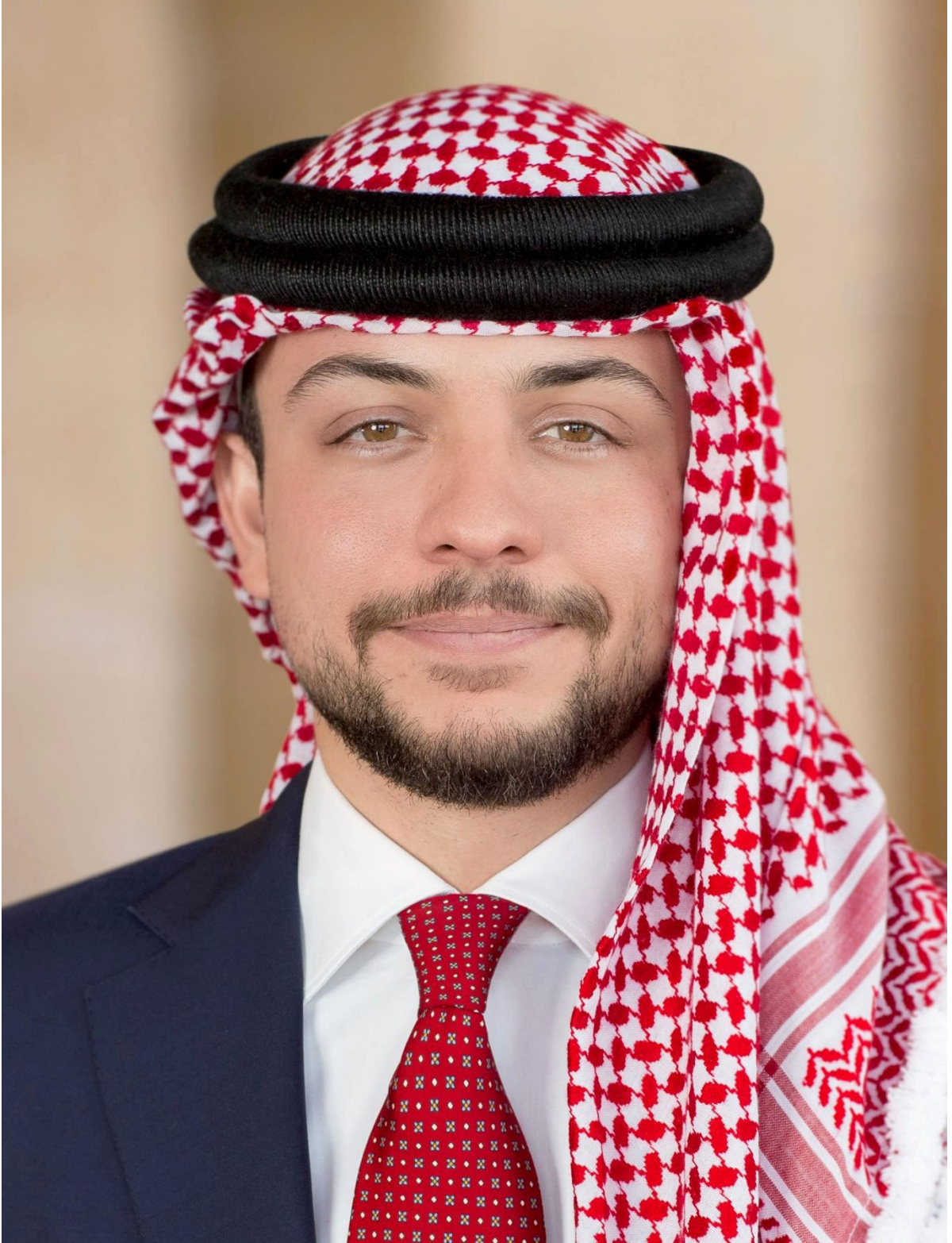
حضرة صاحب السمو الملكي الأمير الحسين بن عبد الله الثاني ولي العهد المعظم