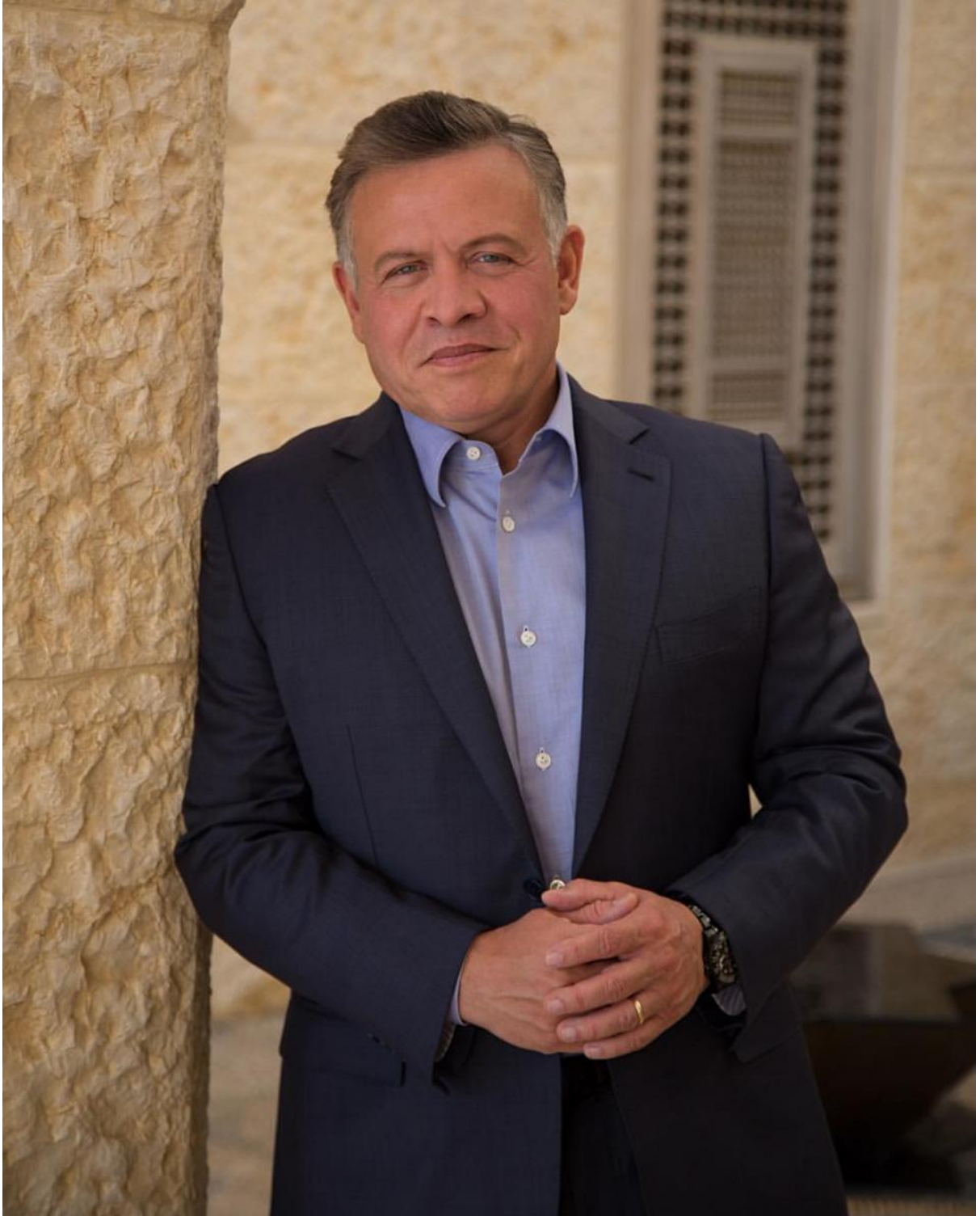
حضرة صاحب الجلالة ملك المملكة الاردنية الهاشمية عبد الله الثاني بن الحسين المعظم