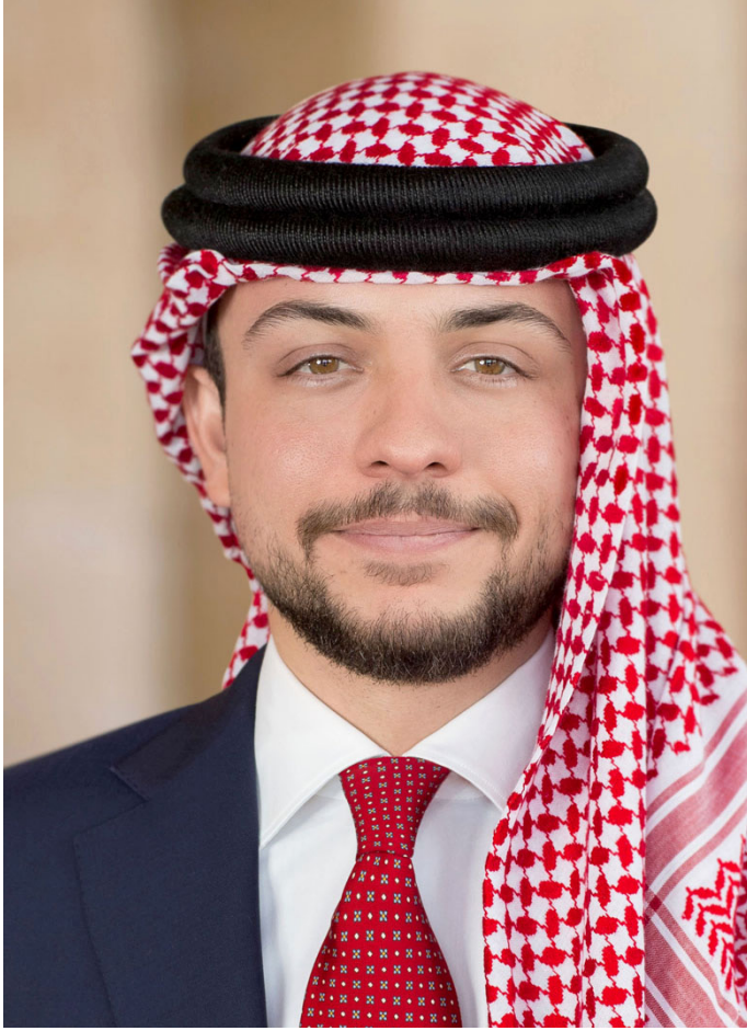
حضرة صاحب السمو الملكي ولي العهد الأمير الحسين ابن عبد الله الثاني المعظم حفظه الله ورعاه