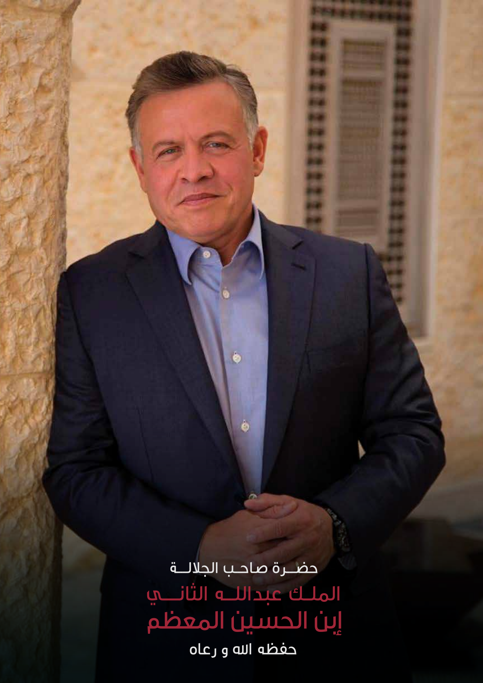
حضرة صاحب الجلالة الملك عبدالله الثاني إبن الحسين المعظم حفظه الله و رعاه