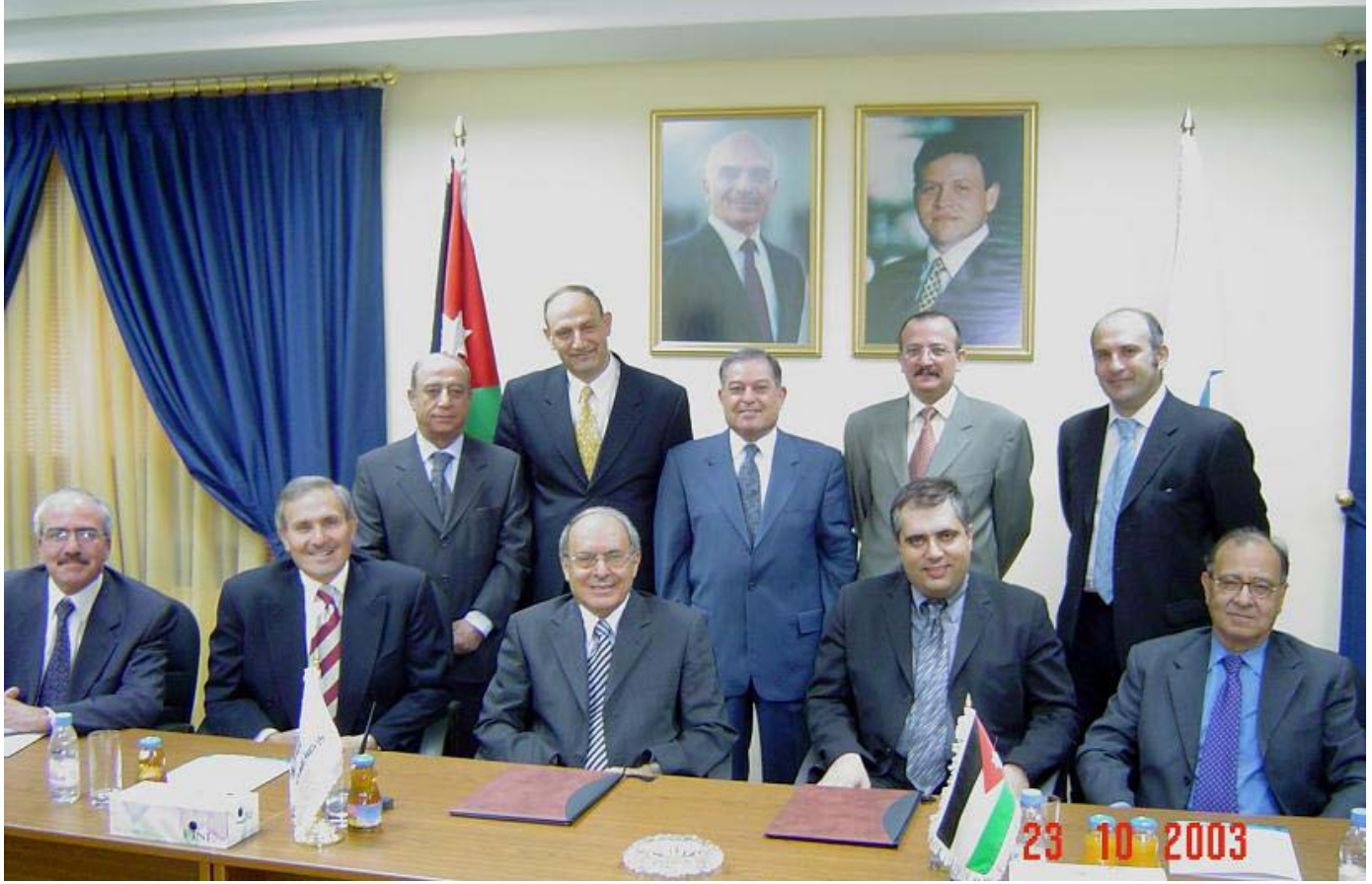
حفل توقيع اتفاقية التعاون المشترك بين بورصة عمان ومركز بورصة سالونيك Signing ceremony of the cooperation agreement between the ASE and Thessaloniki Stock Exchange Center

بلغ عدد الزائرين لموقع البورصة خلال شهر تشرين الثاني حوالي (١٢,٦) مليون زائر، وبذلك يبلغ عدد الزائرين لموقع البورصة منذ بداية العام وحتى نهاية تشرين الثاني (١٢٩,١) مليون زائر.