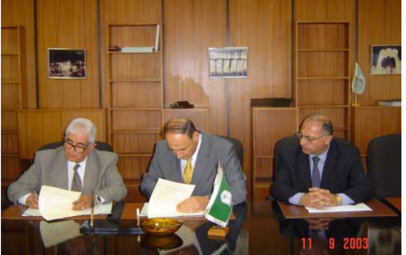
A photo for signing the agreement between ASE and Yarmouk University

والكفاءات البشرية اللازمة لإنشاء هذا المشروع إضافة الى المعلومات اللازمة، كما تقدم جامعة اليرموك مساهمتها بتوفير المكان والكادر البشري. ومما يذكر بأن هذا المشروع يأتي في إطار دعم بورصة عمان لموضوع نشر الوعي العام والتعليم بأهمية البورصة ودورها الأساسي في تشجيع الاستثمار وتعزيز النمو الاقتصادي.